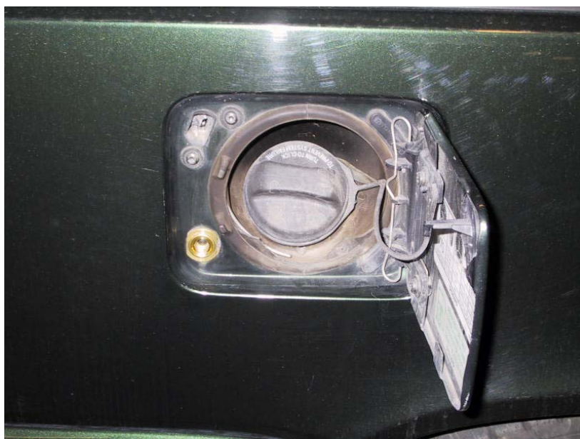
Valvola di carica.

La Tartarini Auto si riserva di apportare modifiche e migliorie alle indicazioni, illustrazioni e foto presenti nel presente manuale, senza l'obbligo di nessun preavviso