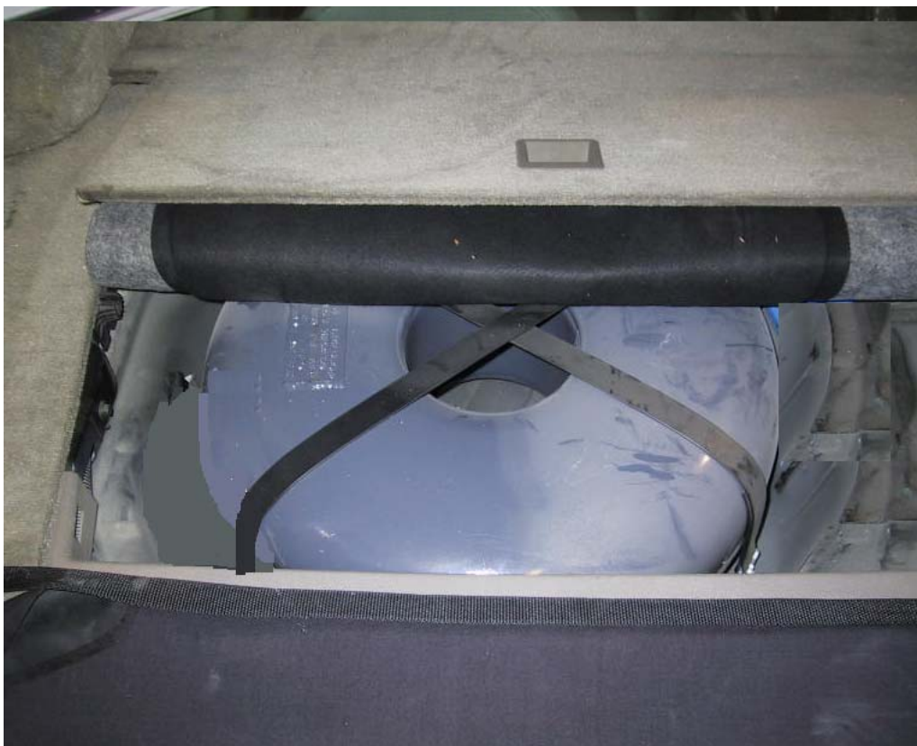
Installazione del serbatoio gpl.