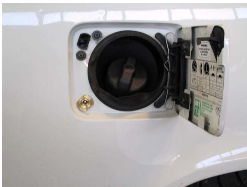
Valvola di carica.

La Tartarini Auto si riserva di apportare modifiche e migliorie alle indicazioni, illustrazioni e foto presenti nel presente manuale, senza l'obbligo di nessun preavviso