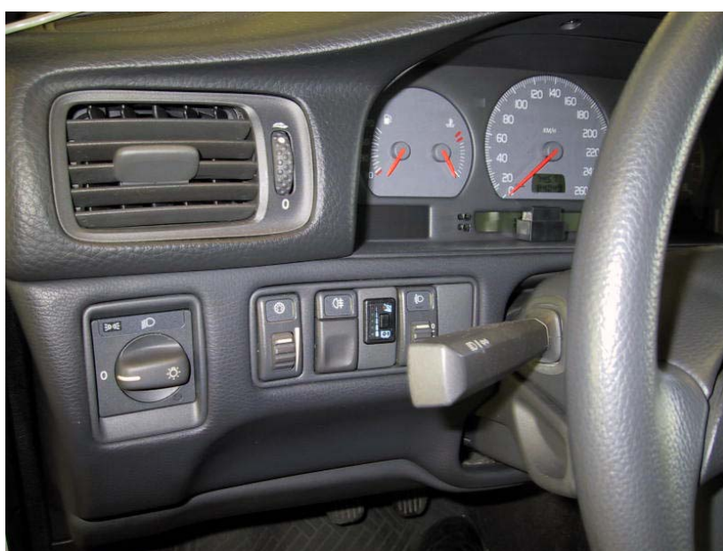
Posizione del commutatore

La Tartarini Auto si riserva di apportare modifiche e migliorie alle indicazioni, illustrazioni e foto presenti nel presente manuale, senza l'obbligo di nessun preavviso