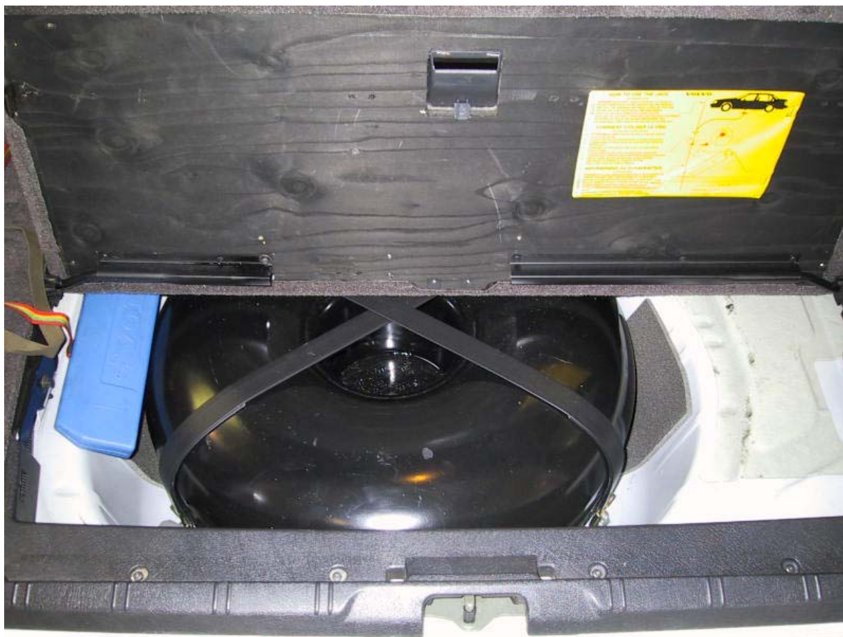
Installazione serbatoio del gas