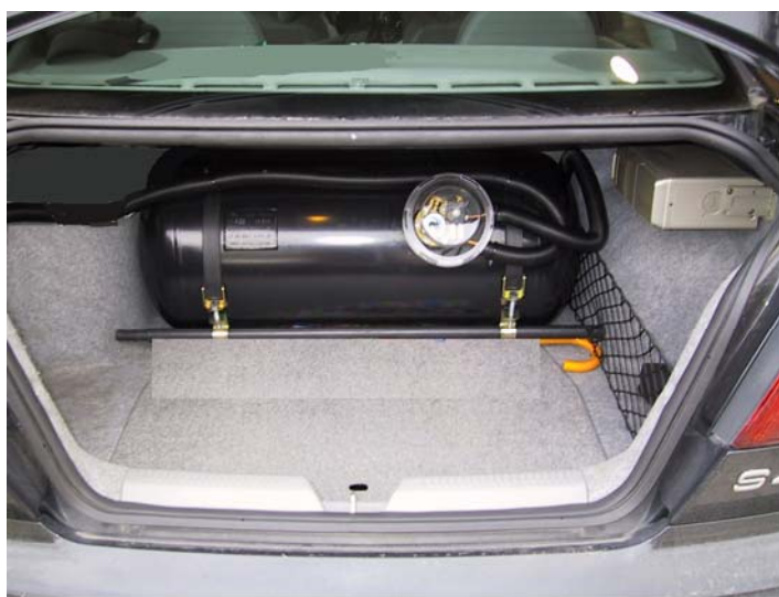
Installazione serbatoio del gas