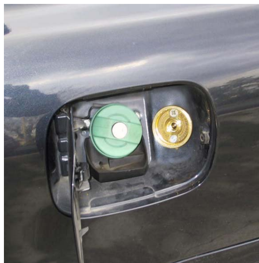
Valvola di carica

La Tartarini Auto si riserva di apportare modifiche e migliorie alle indicazioni, illustrazioni e foto presenti nel presente manuale, senza l'obbligo di nessun preavviso