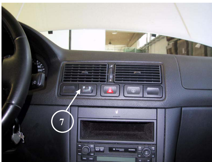
7) Posizione del commutatore

La Tartarini Auto si riserva di apportare modifiche e migliorie alle indicazioni, illustrazioni e foto presenti nel presente manuale, senza l'obbligo di nessun preavviso