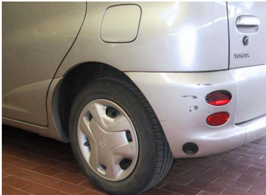
Valvola di carica