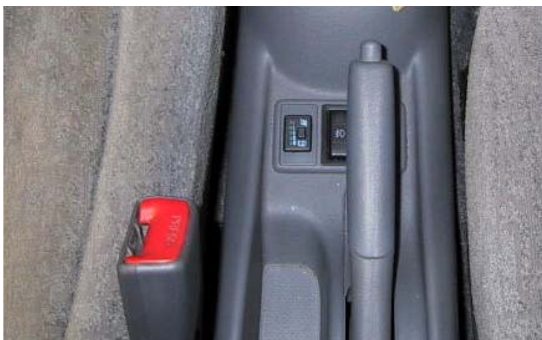
Posizione del commutatore.

La Tartarini Auto si riserva di apportare modifiche e migliorie alle indicazioni, illustrazioni senza l'obbligo di nessun preavviso