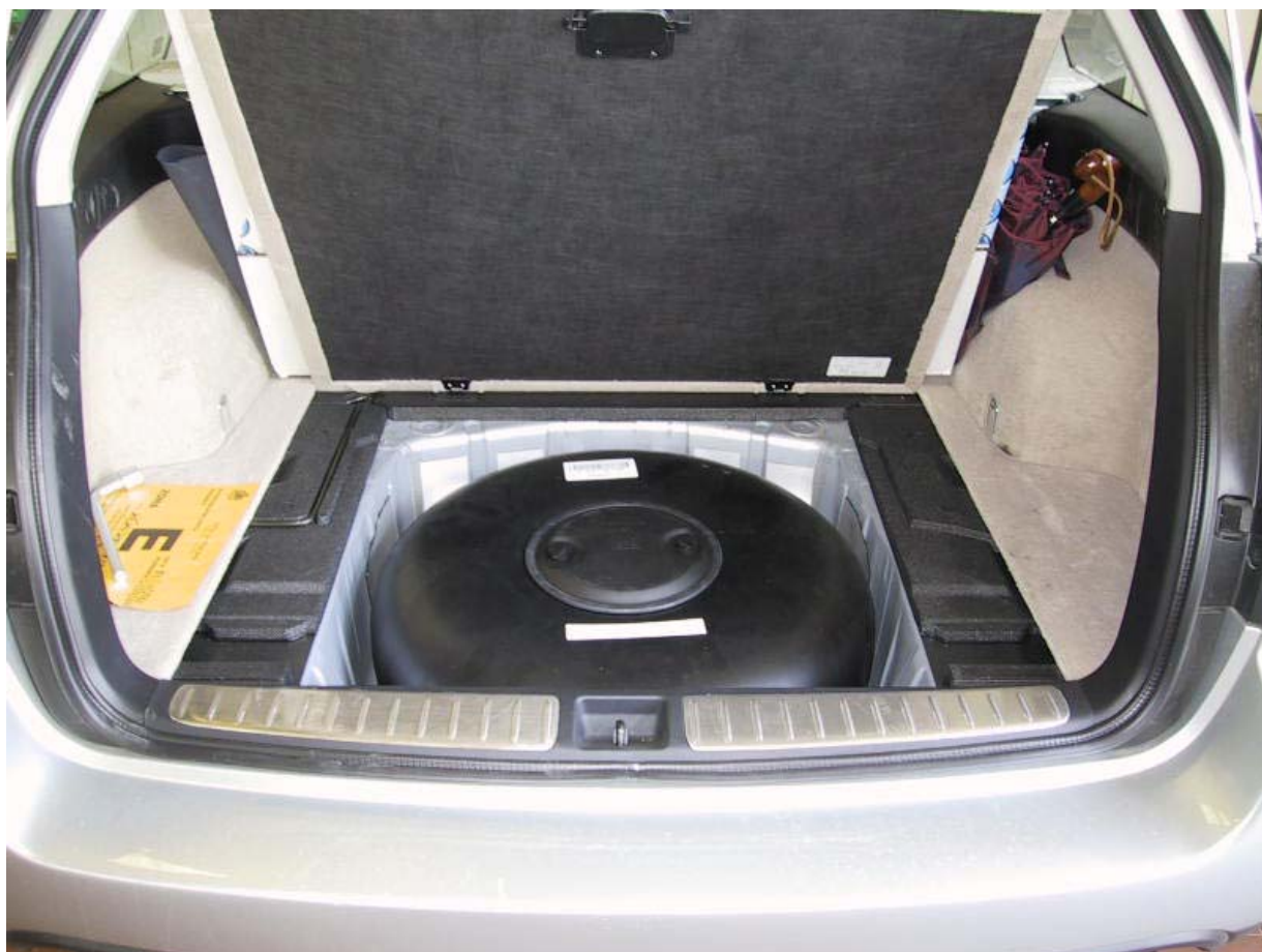
Installazione del serbatoio gpl