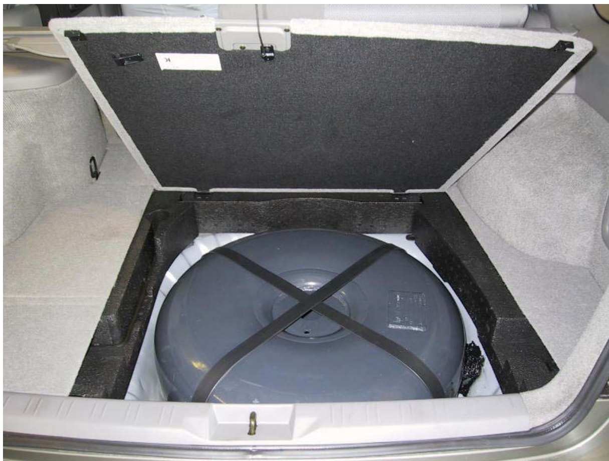
Installazione del serbatoio gpl