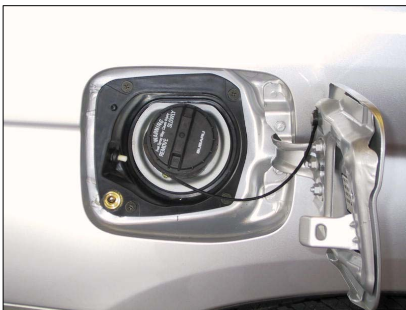
Valvola di carica

La Tartarini Auto si riserva di apportare modifiche e migliorie alle indicazioni, illustrazioni e foto presenti nel presente manuale, senza l'obbligo di nessun preavviso