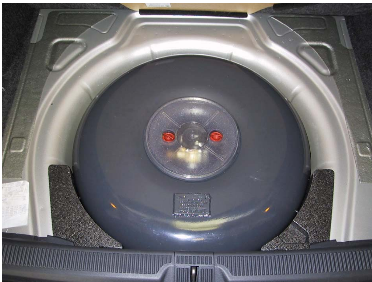
Installazione del serbatoio gpl

La Tartarini Auto si riserva di apportare modifiche e migliorie alle indicazioni, illustrazioni e foto presenti nel presente manuale, senza l'obbligo di nessun preavviso