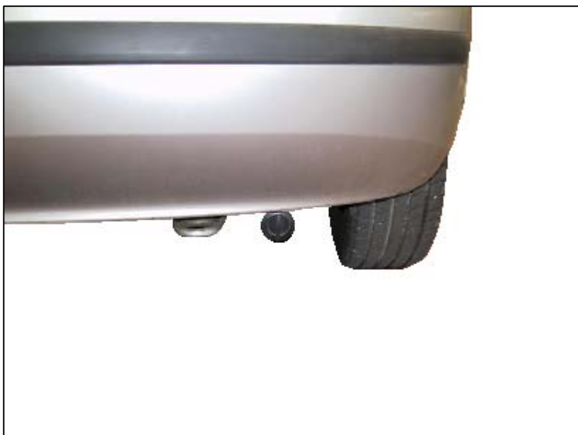
Valvola di carica.