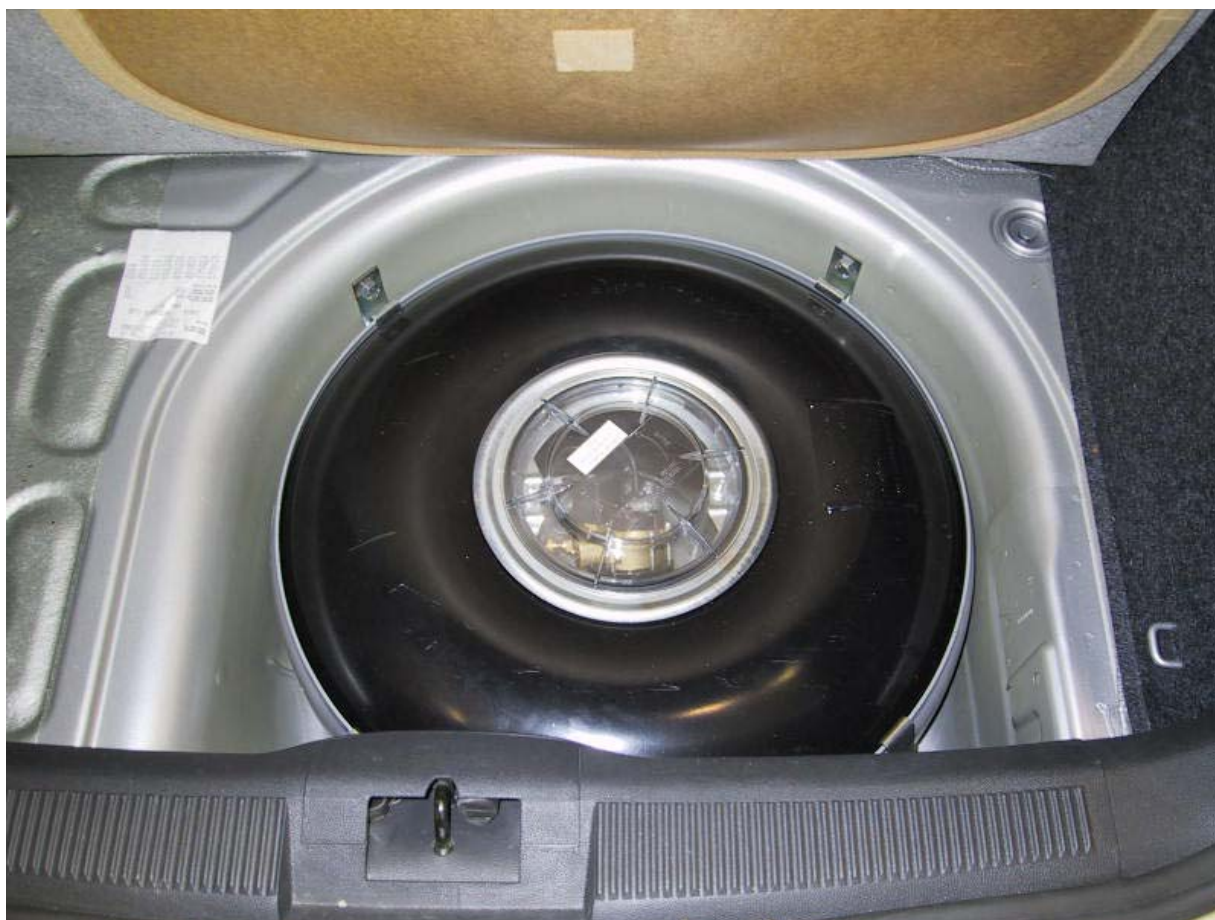
Installazione del serbatoio gpl.