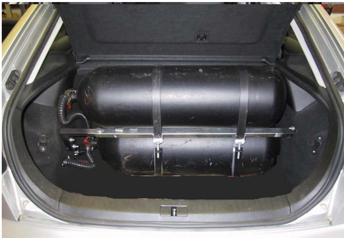
Installazione bombole metano.