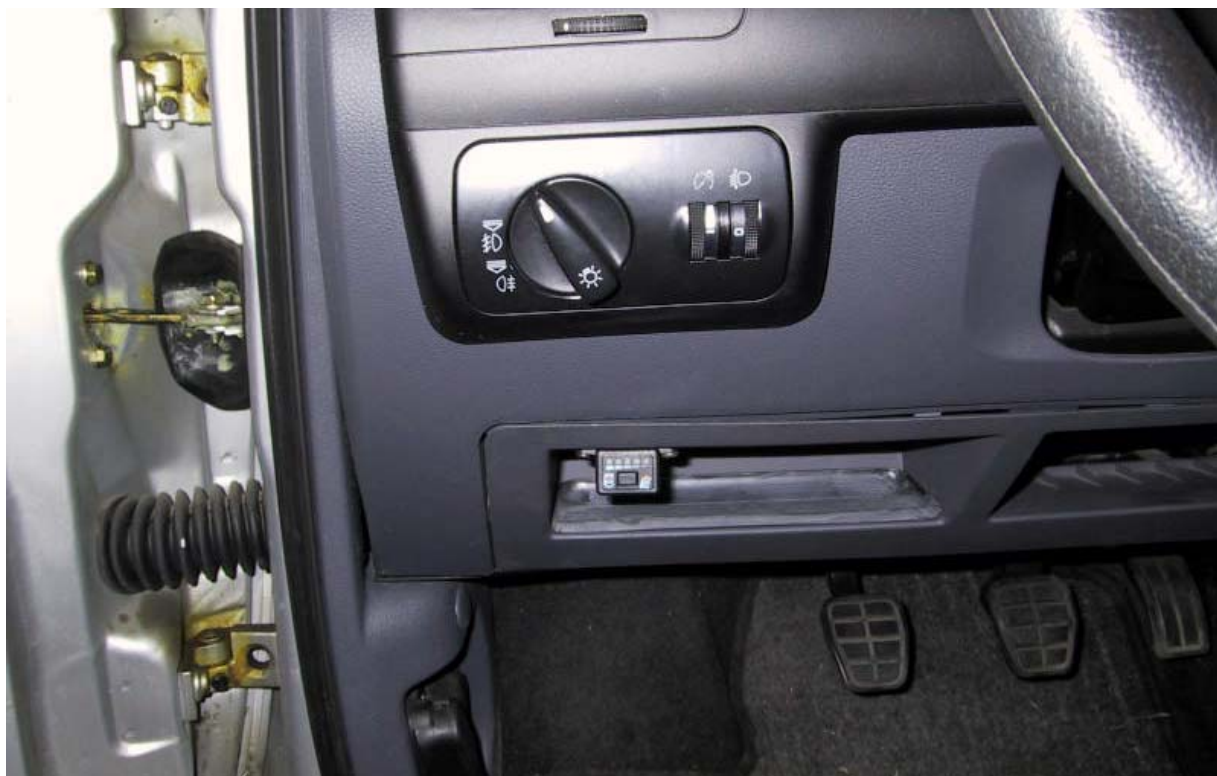
Posizione del commutatore.