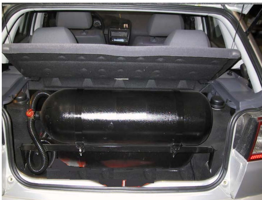
Installazione bombole metano.

La Tartarini Auto si riserva di apportare modifiche e migliorie alle indicazioni, illustrazioni e foto presenti nel presente manuale, senza l'obbligo di nessun preavviso