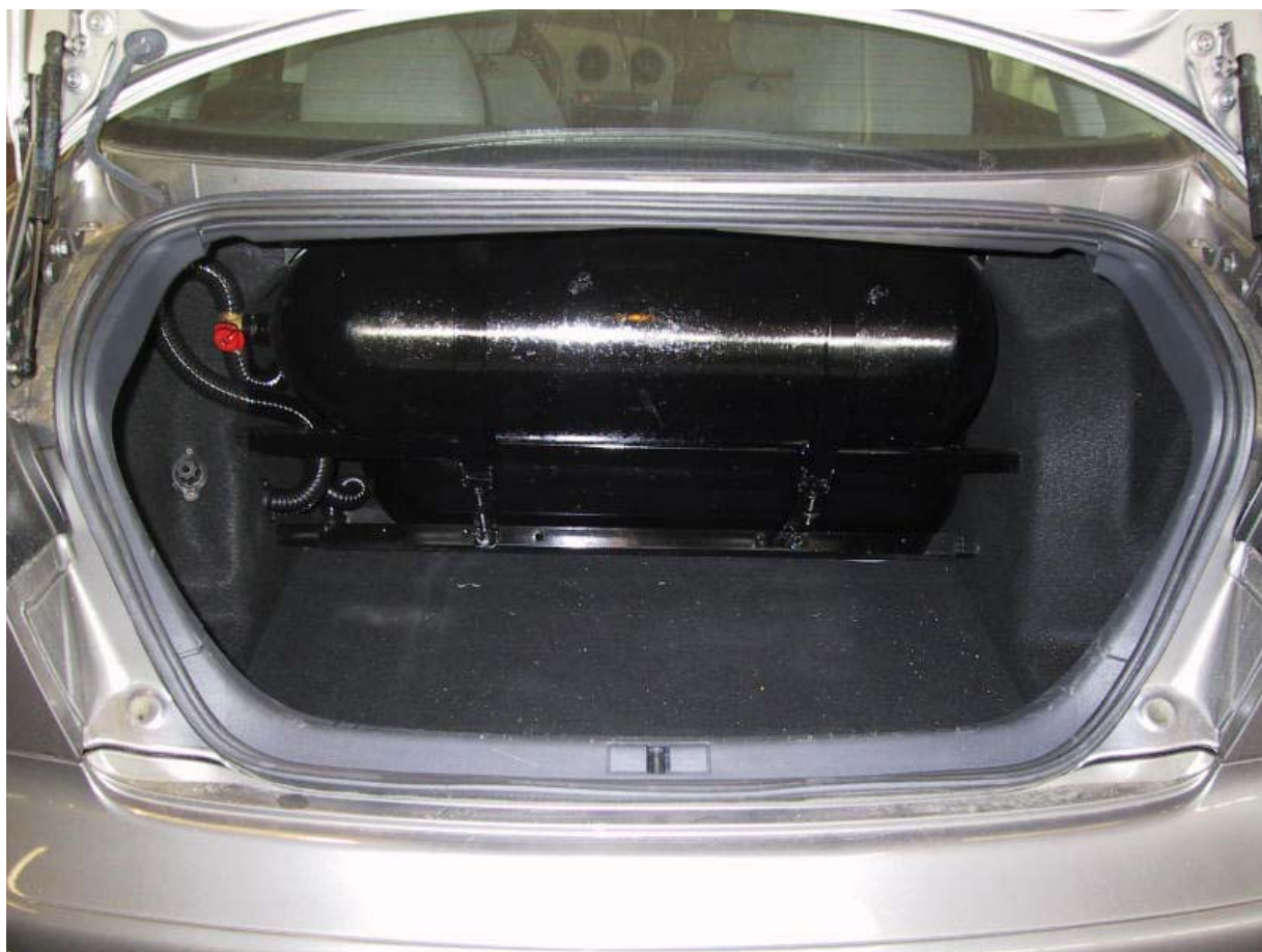
Installazione bombole metano.