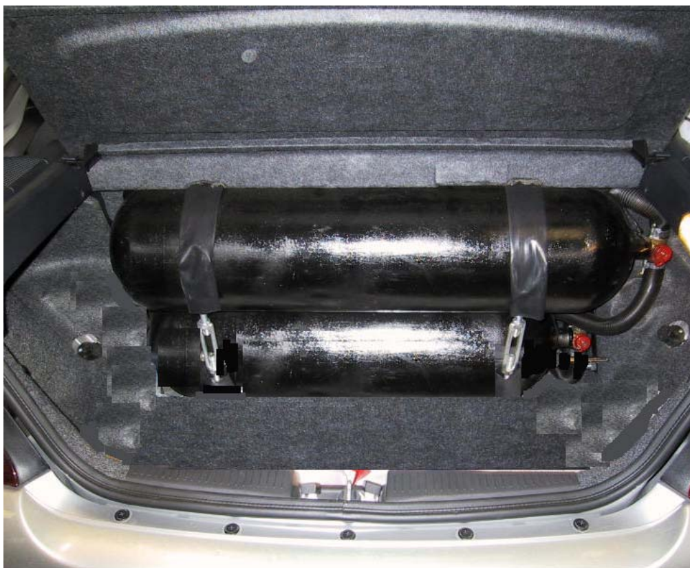
Installazione bombole metano.