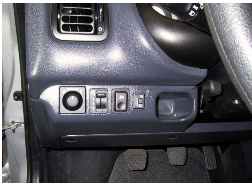
Posizione del commutatore.

La Tartarini Auto si riserva di apportare modifiche e migliorie alle indicazioni, illustrazioni e foto presenti nel presente manuale, senza l'obbligo di nessun preavviso