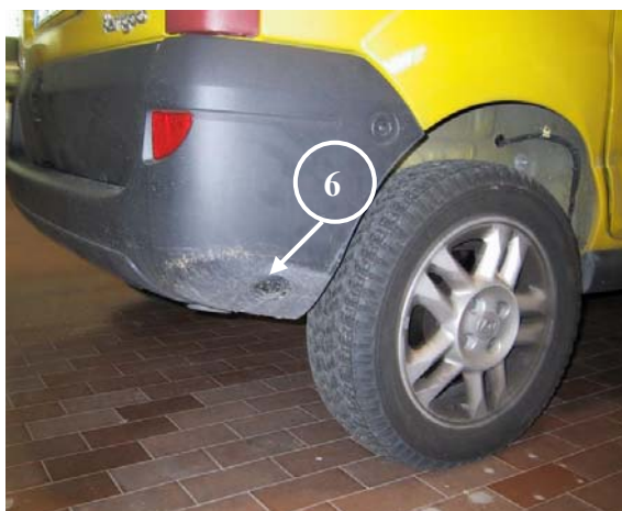
6) Valvola di carica

La Tartarini Auto si riserva di apportare modifiche e migliorie alle indicazioni, illustrazioni e foto presenti nel presente manuale, senza l'obbligo di nessun preavviso