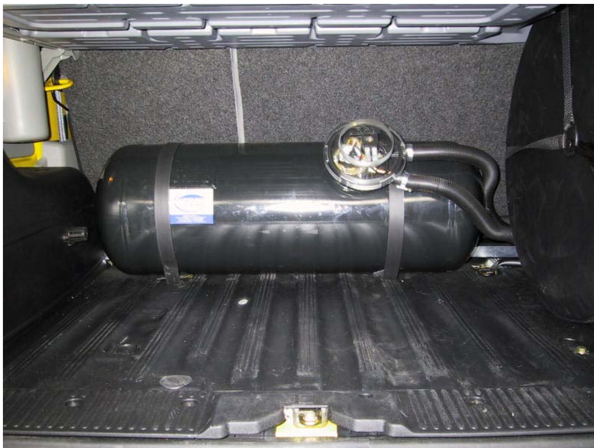
Installazione serbatoio del gas