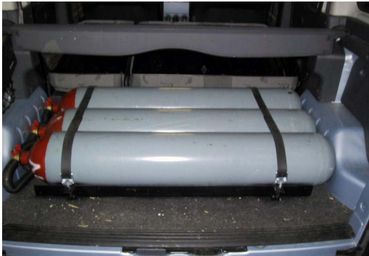
Installazione bombole metano.

La Tartarini Auto si riserva di apportare modifiche e migliorie alle indicazioni, illustrazioni e foto presenti nel presente manuale, senza l'obbligo di nessun preavviso