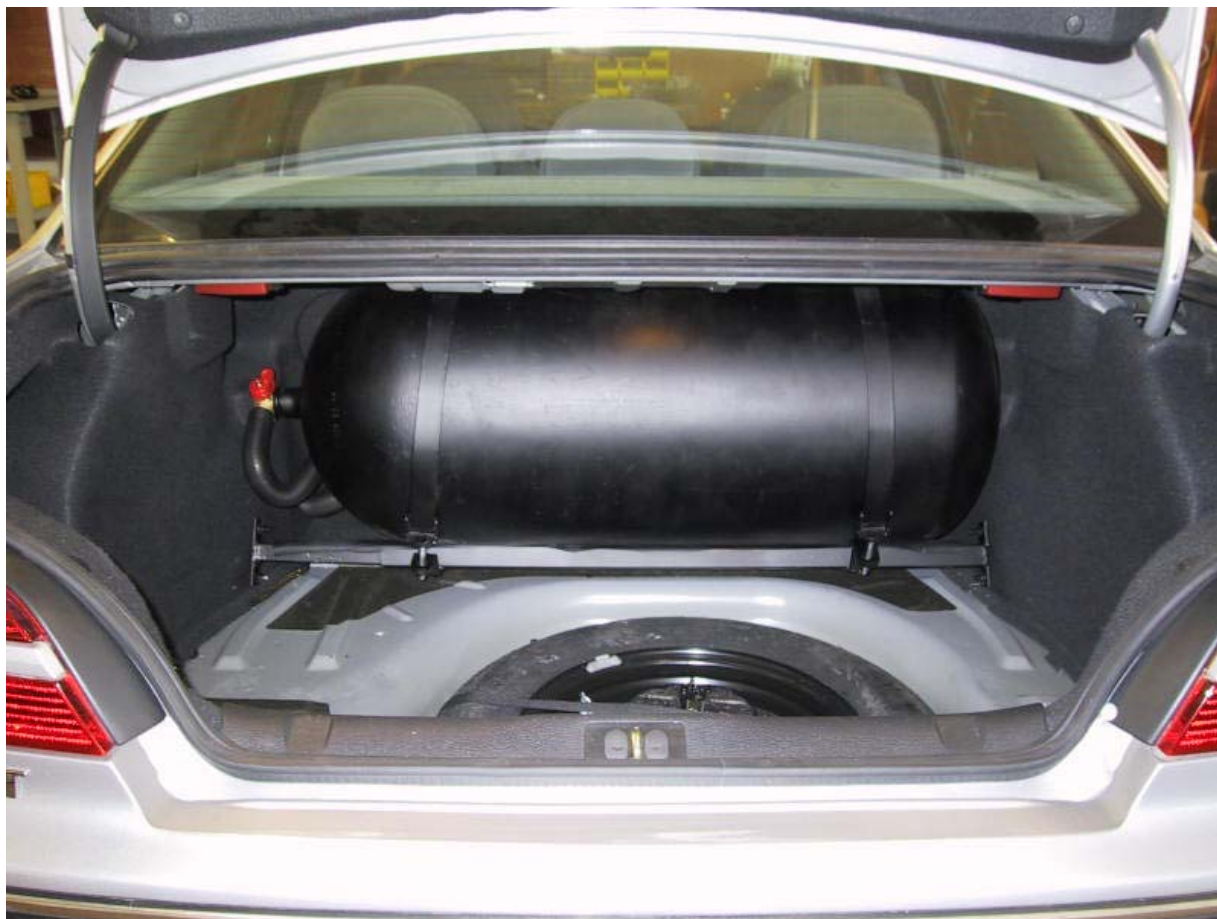
Installazione bombole metano.