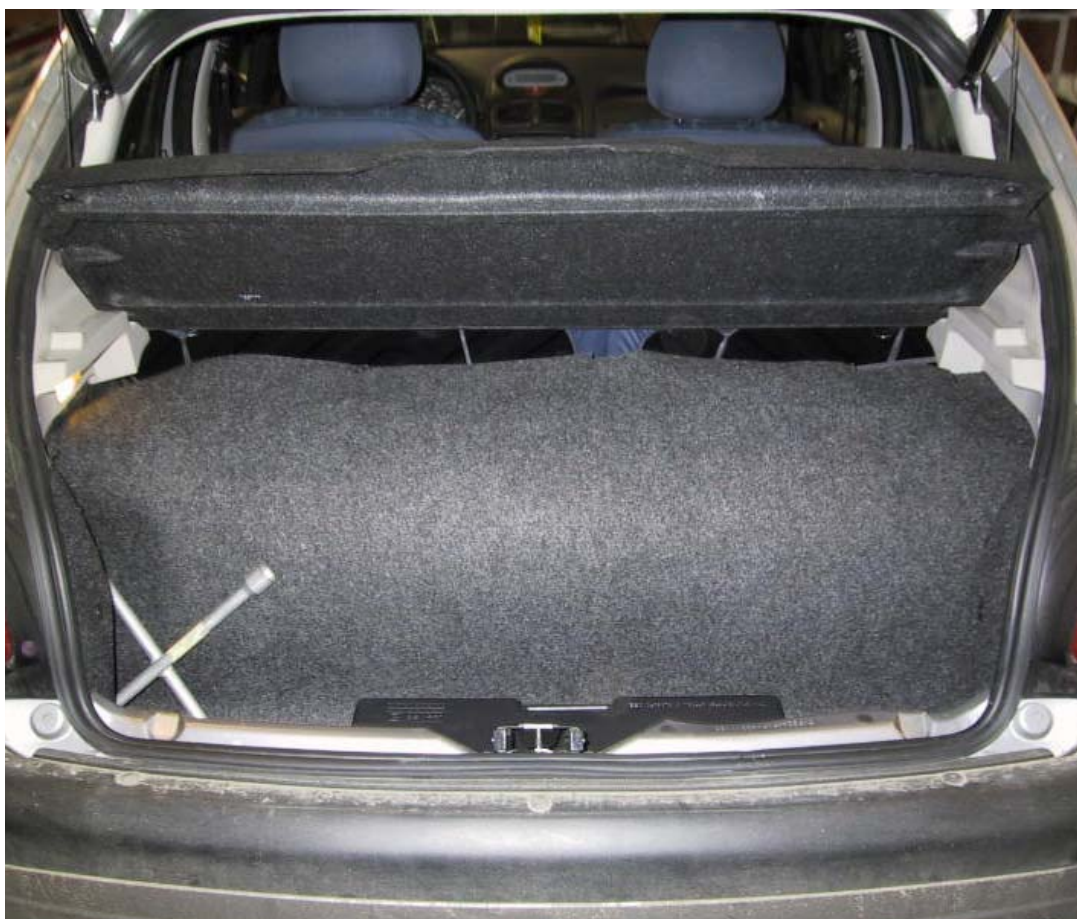
Installazione bombole metano.