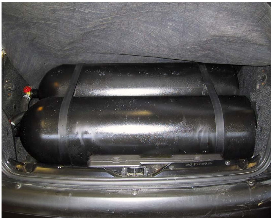
Installazione bombole metano.