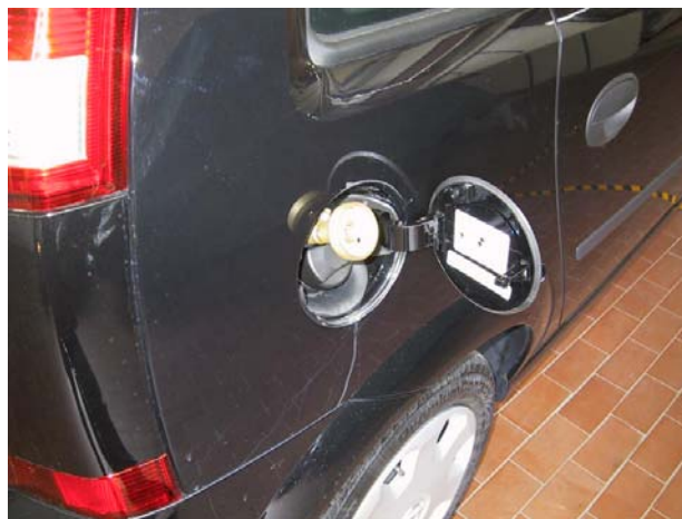
Raccordo di carica.