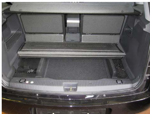
Installazione del serbatoio gpl.