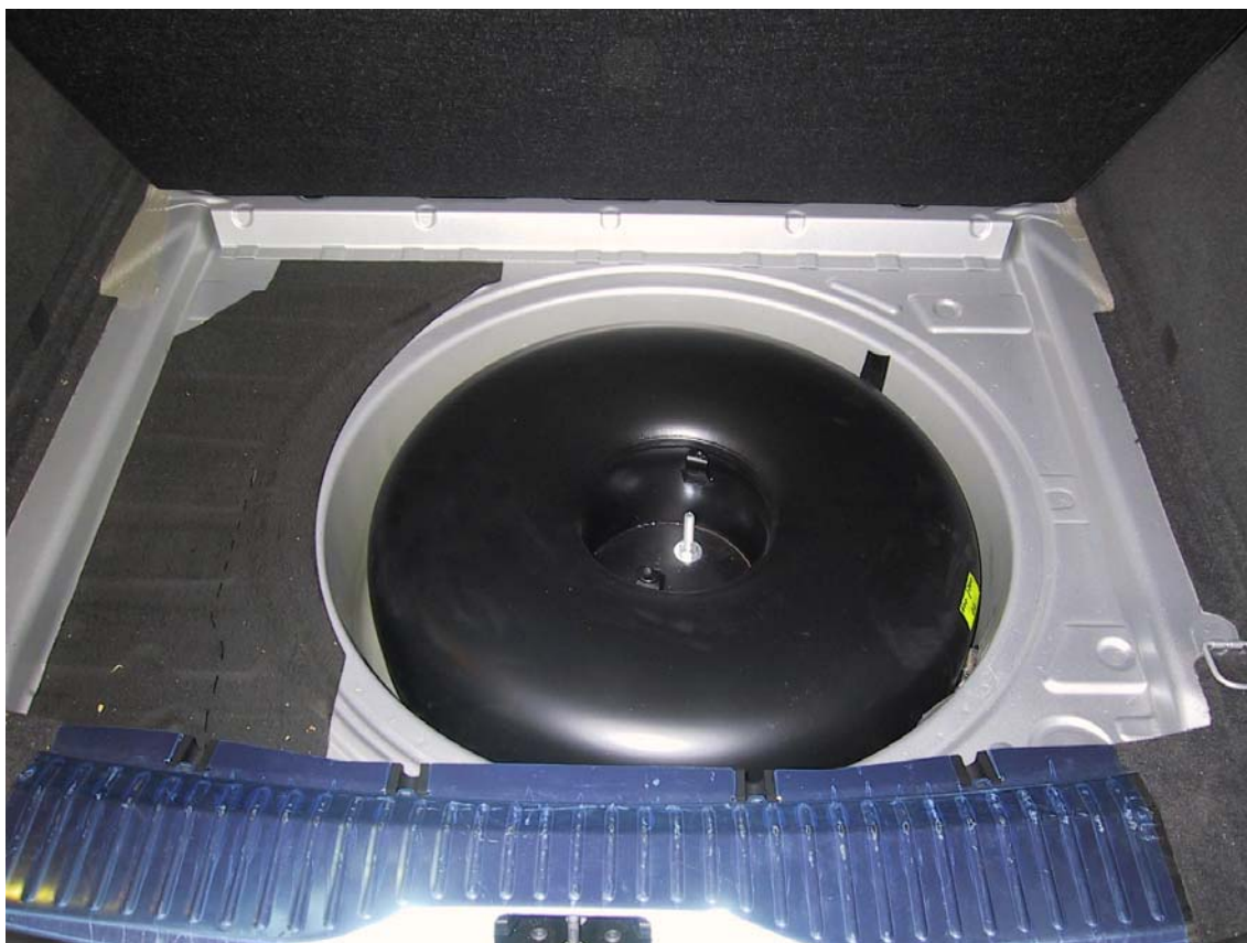
Installazione del serbatoio del gas