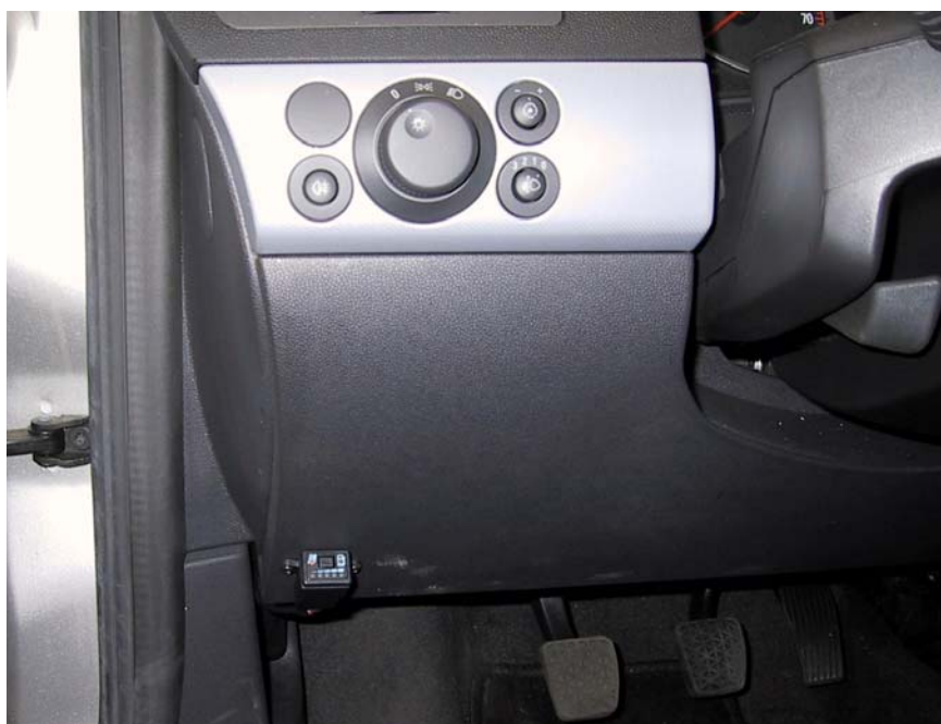
Posizione del commutatore