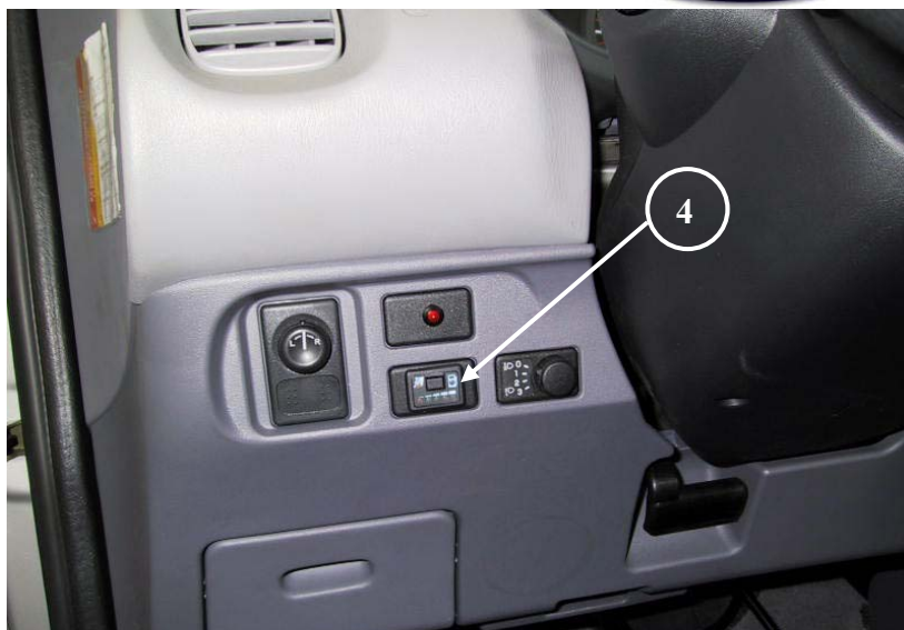
4 ) Posizione del commutatore.