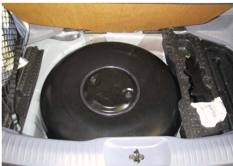
Installazione serbatoio del gas