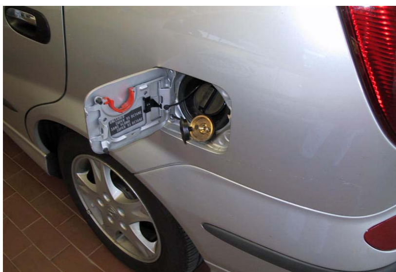
Valvola di carica.