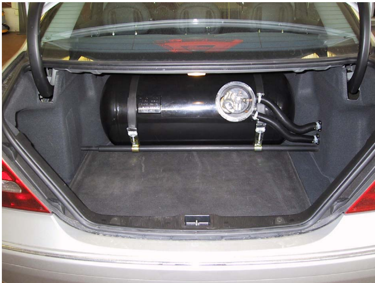
Installazione del serbatoio gpl