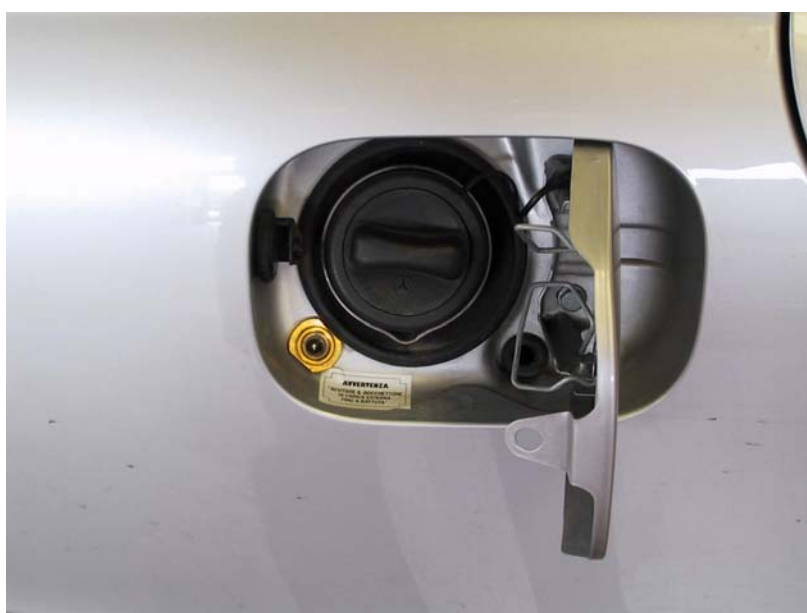
Valvola di carica.