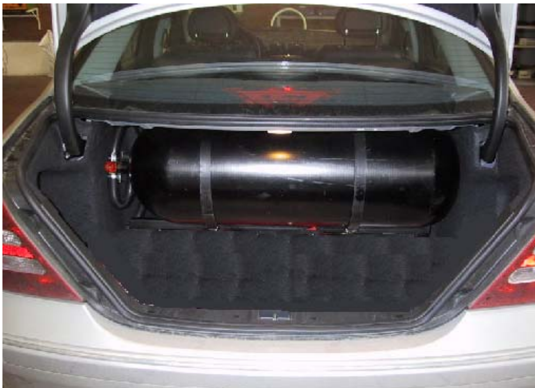
Installazione bombole metano.