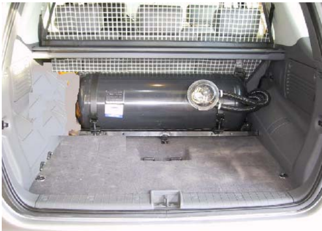
Installazione del serbatoio gpl.