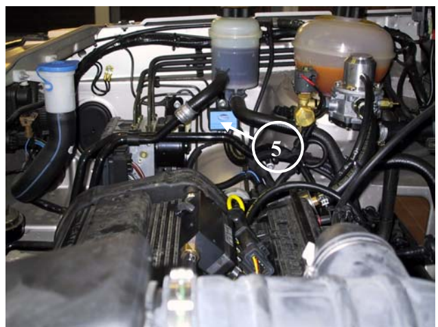
5) Misuratore di pressione