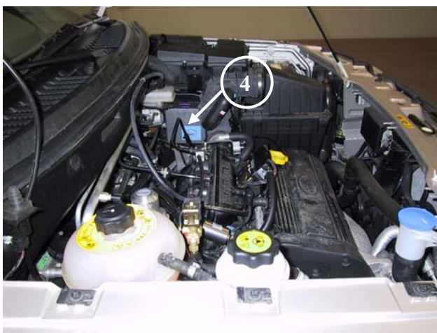
4) Centralina elettronica del gas