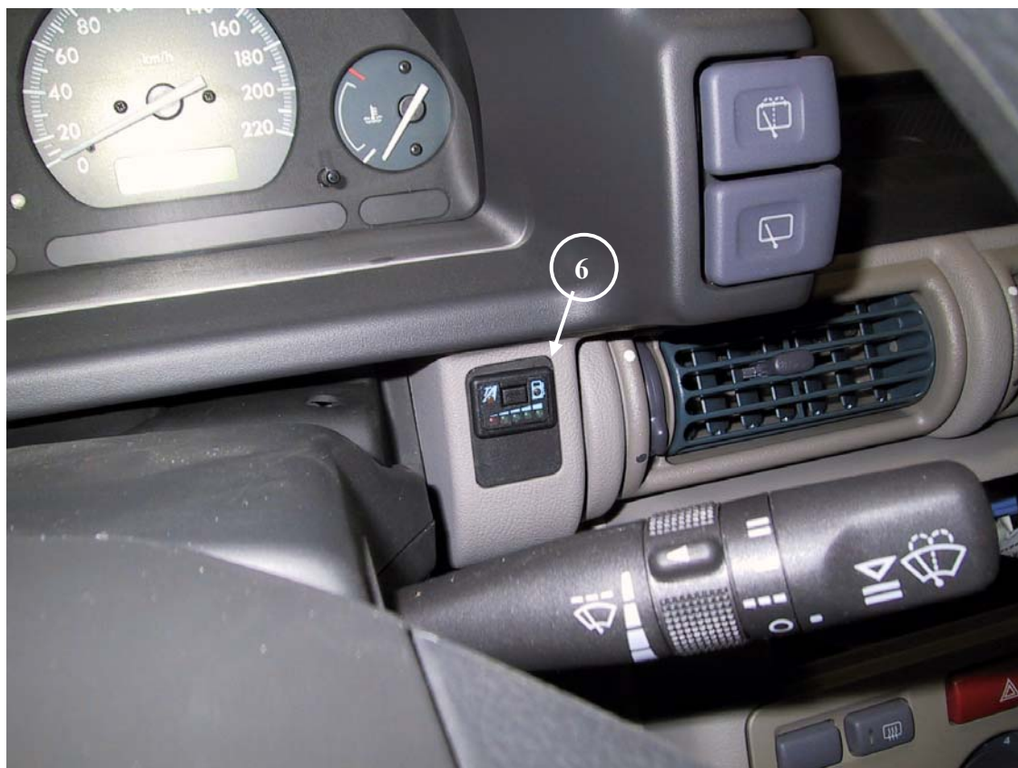
6) Posizione del commutatore