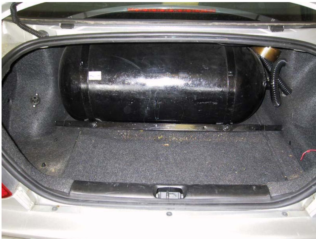
installazione bombola metano.