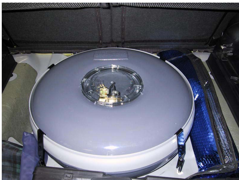
Installazione serbatoio del gas