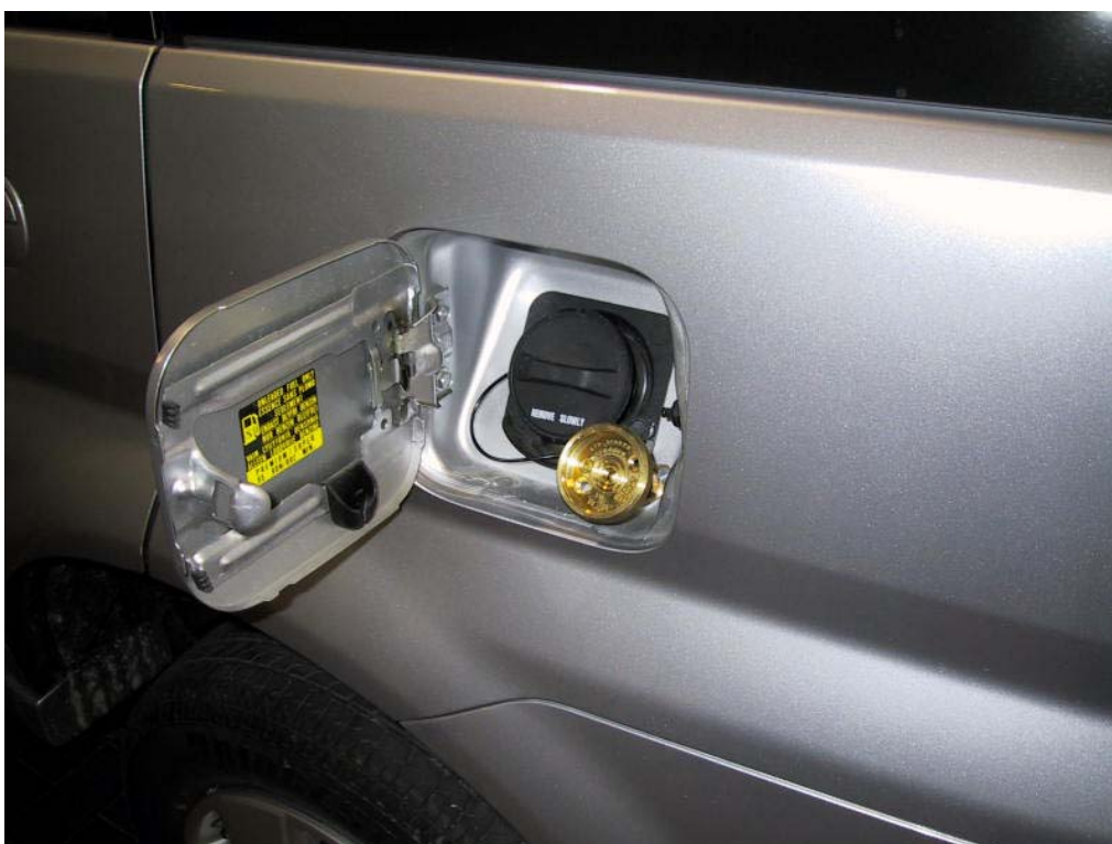
Valvola di carica del gas