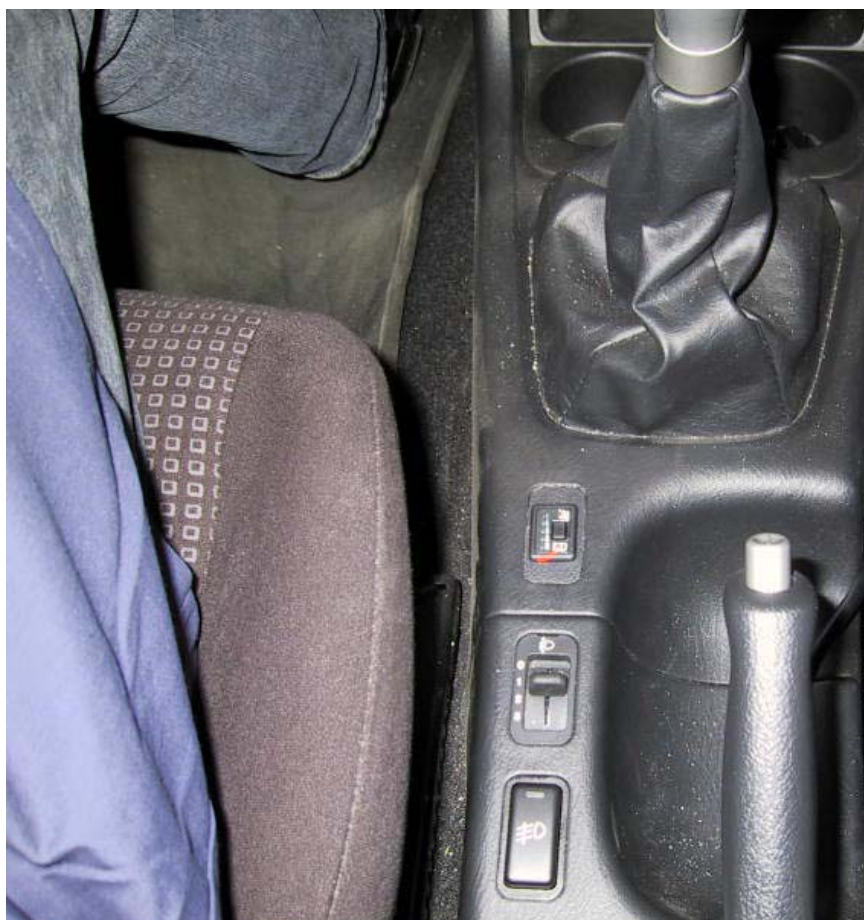
Posizione del commutatore.