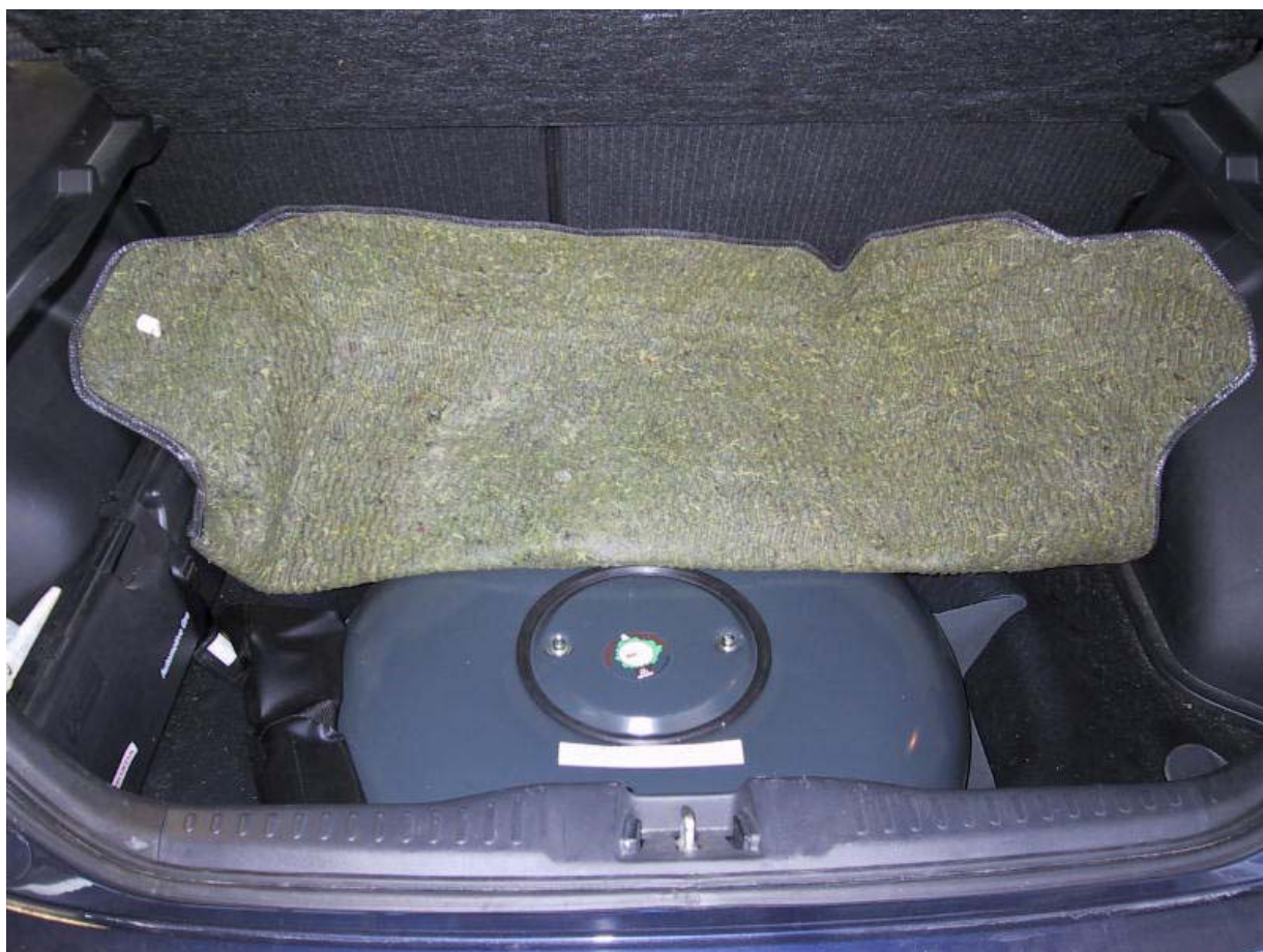
Installazione del serbatoio gpl