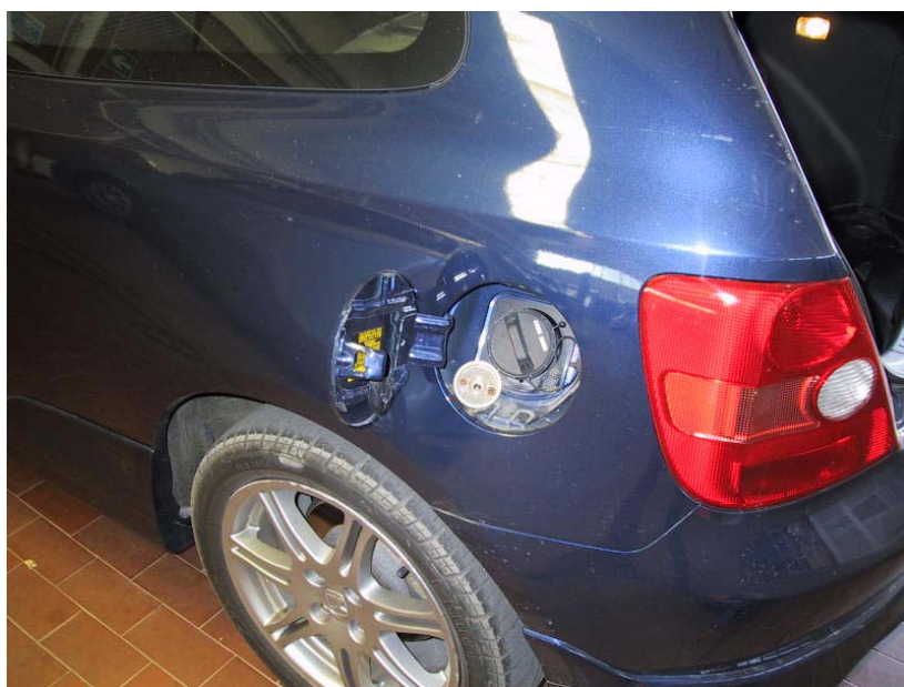
Valvola di carica