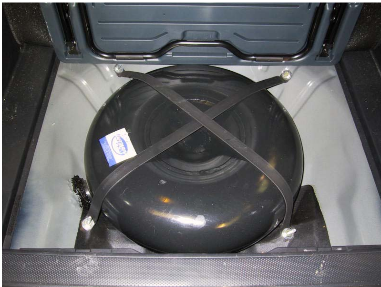
Installazione serbatoio del gas