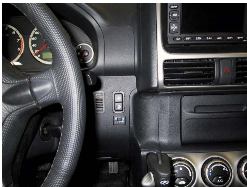
Posizione del commutatore.