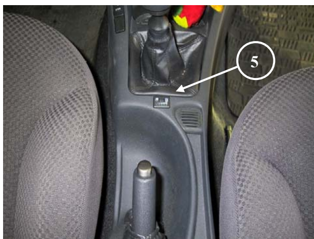
5) Posizione del commutatore.