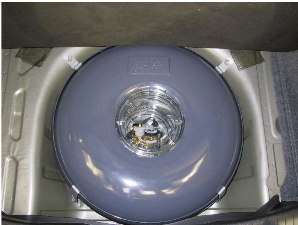
Installazione serbatoio del gas