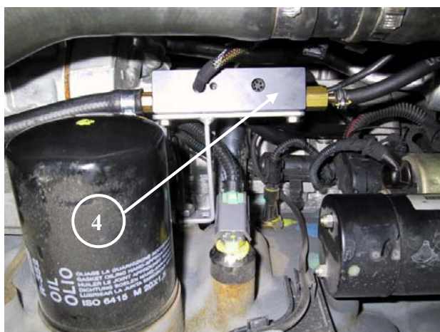
4) Gruppo iniettori del gas