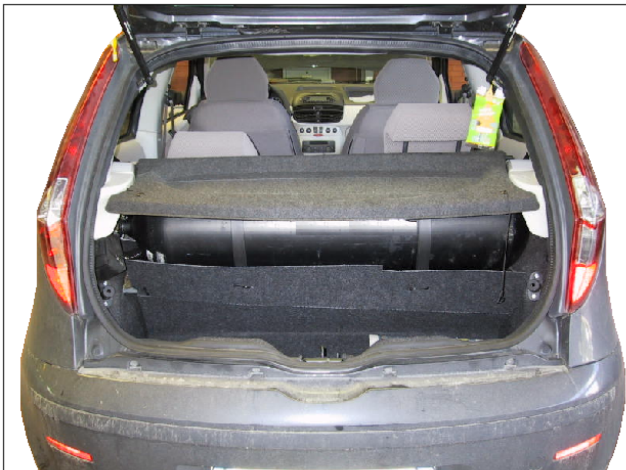
Installazione bombole metano.