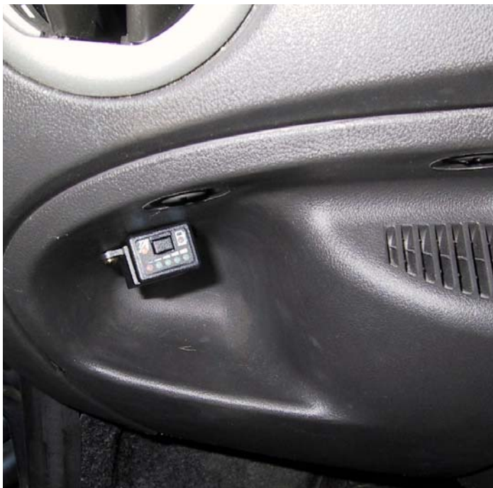
Posizione del commutatore