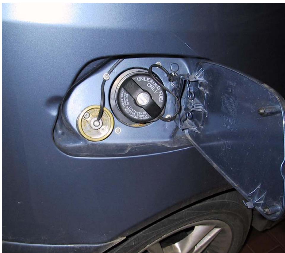
Posizione valvola di carica del gas