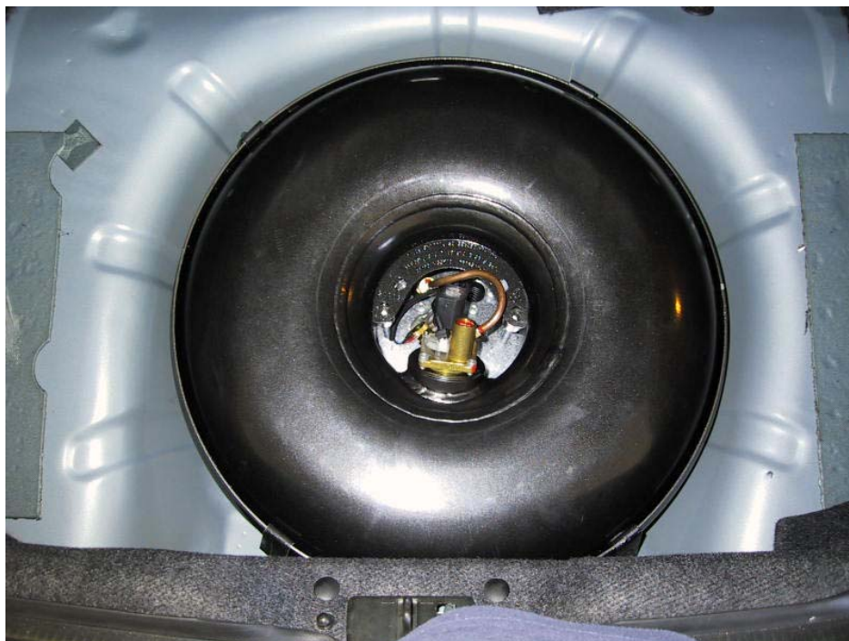
Installazione del serbatoio del gas