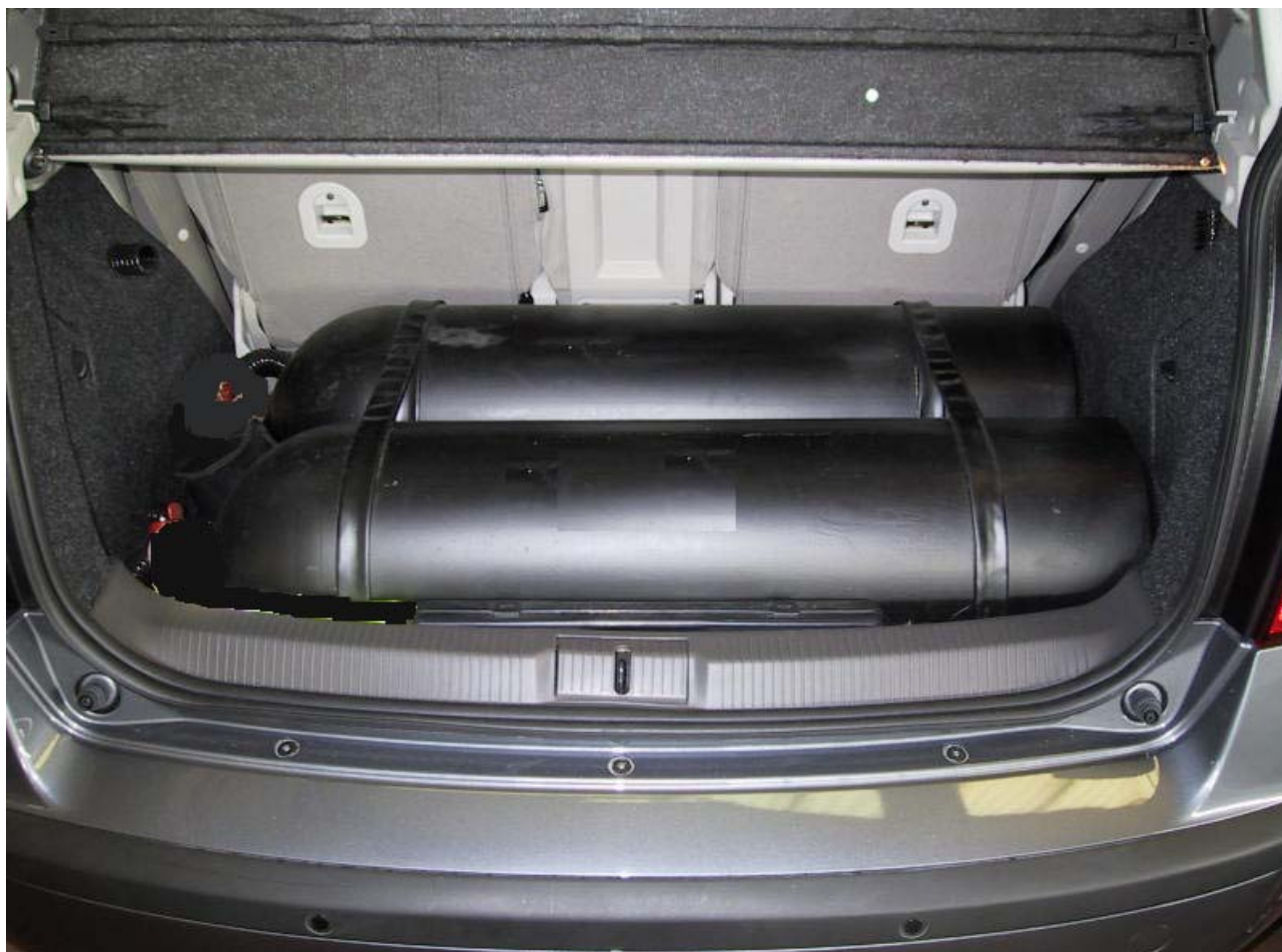
Installazione bombole metano.