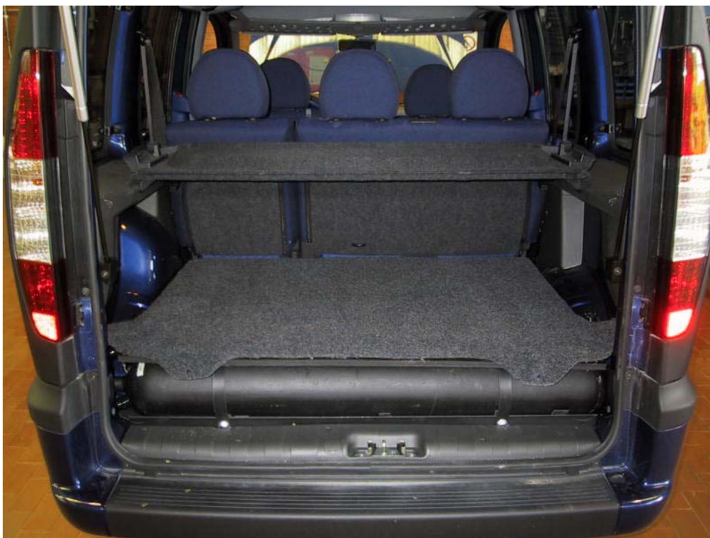
Installazione delle bombole