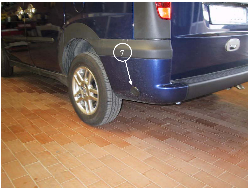
7) Valvola di carica del gas