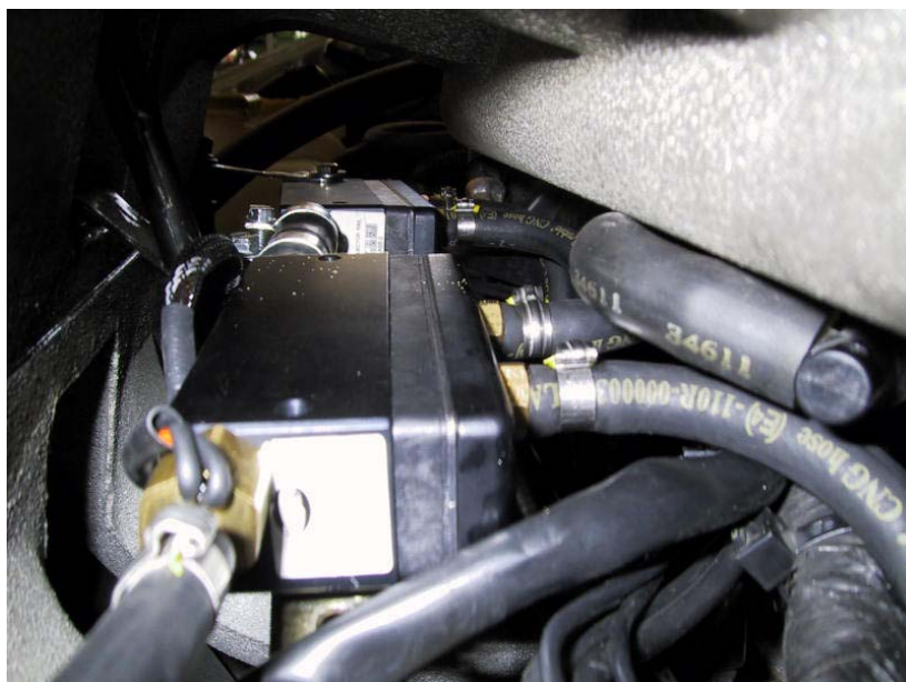
Gruppo iniettori del gas. Di tipo super.