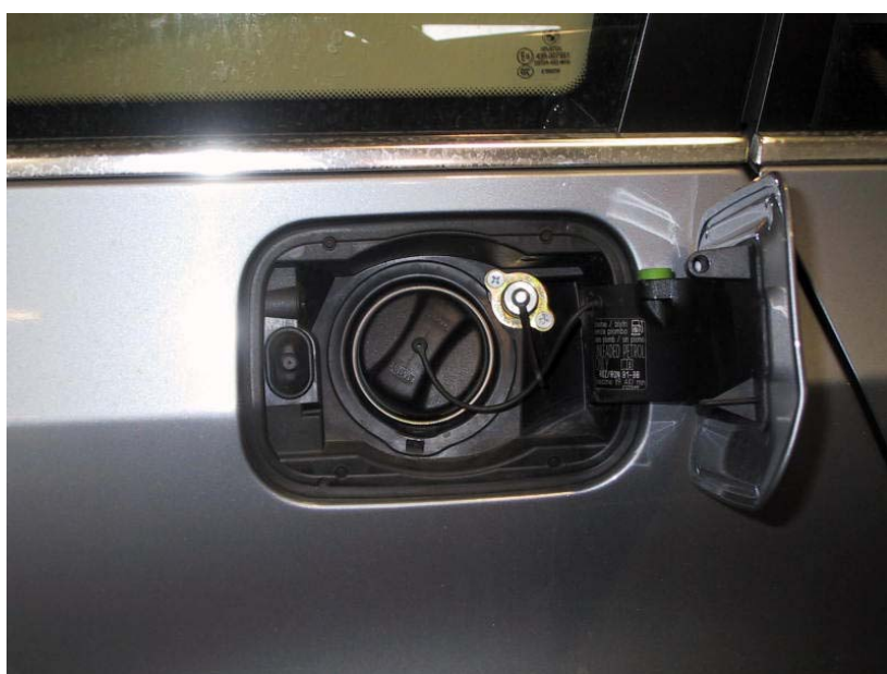
Valvola di carica.