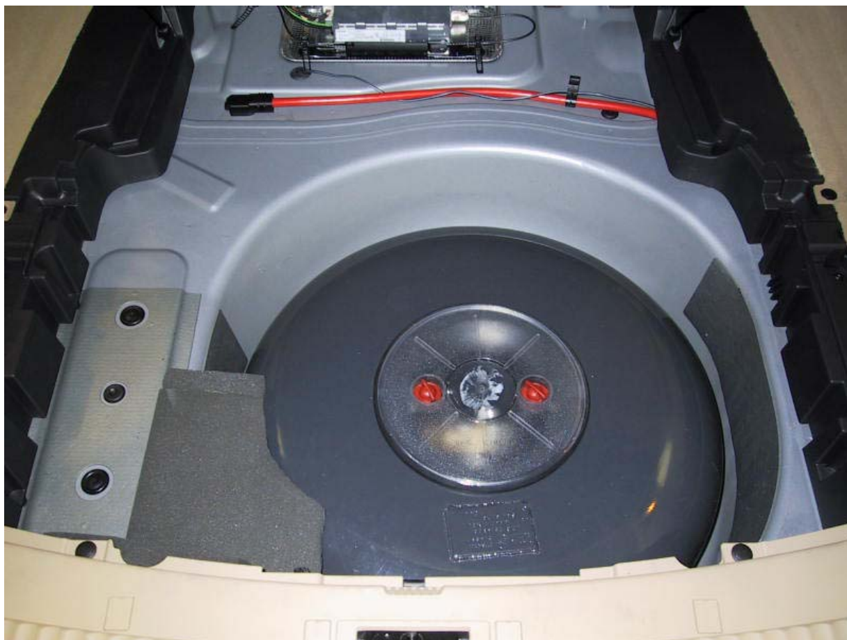
Installazione del serbatoio del gas