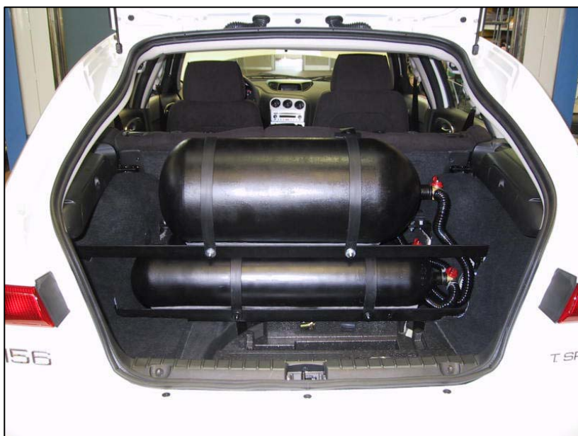
Installazione bombole metano.