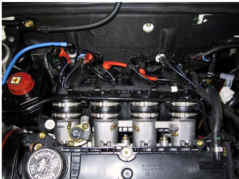
Posizione raccordi del gas, sui condotti di aspirazione.