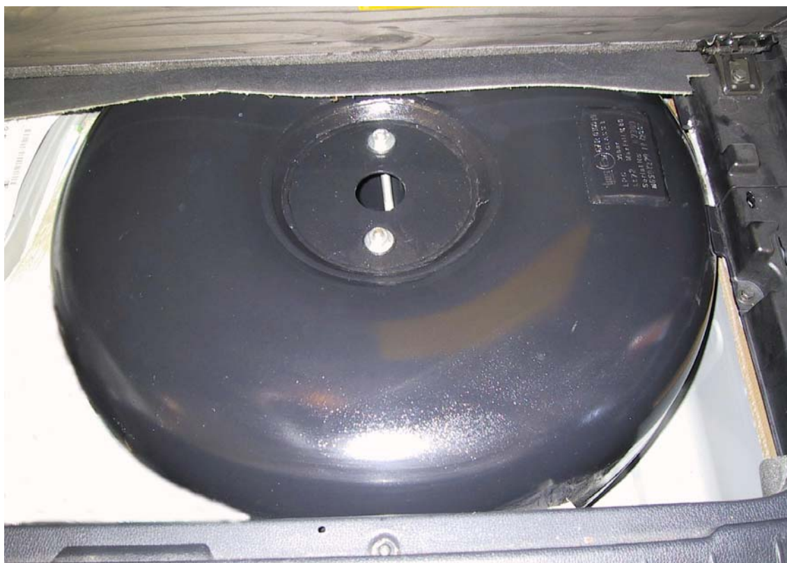
Installazione del serbatoio del gas

La Tartarini Auto si riserva di apportare modifiche e migliorie alle indicazioni, illustrazioni e foto presenti nel presente manuale, senza l'obbligo di nessun preavviso