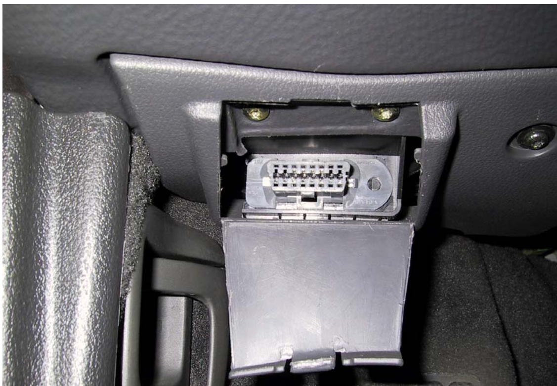
Posizione presa OBD