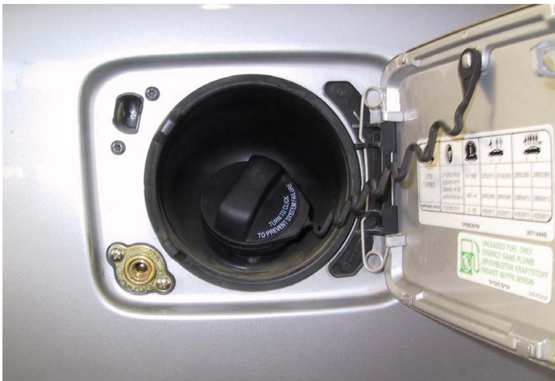
Posizione valvola di carica del gas