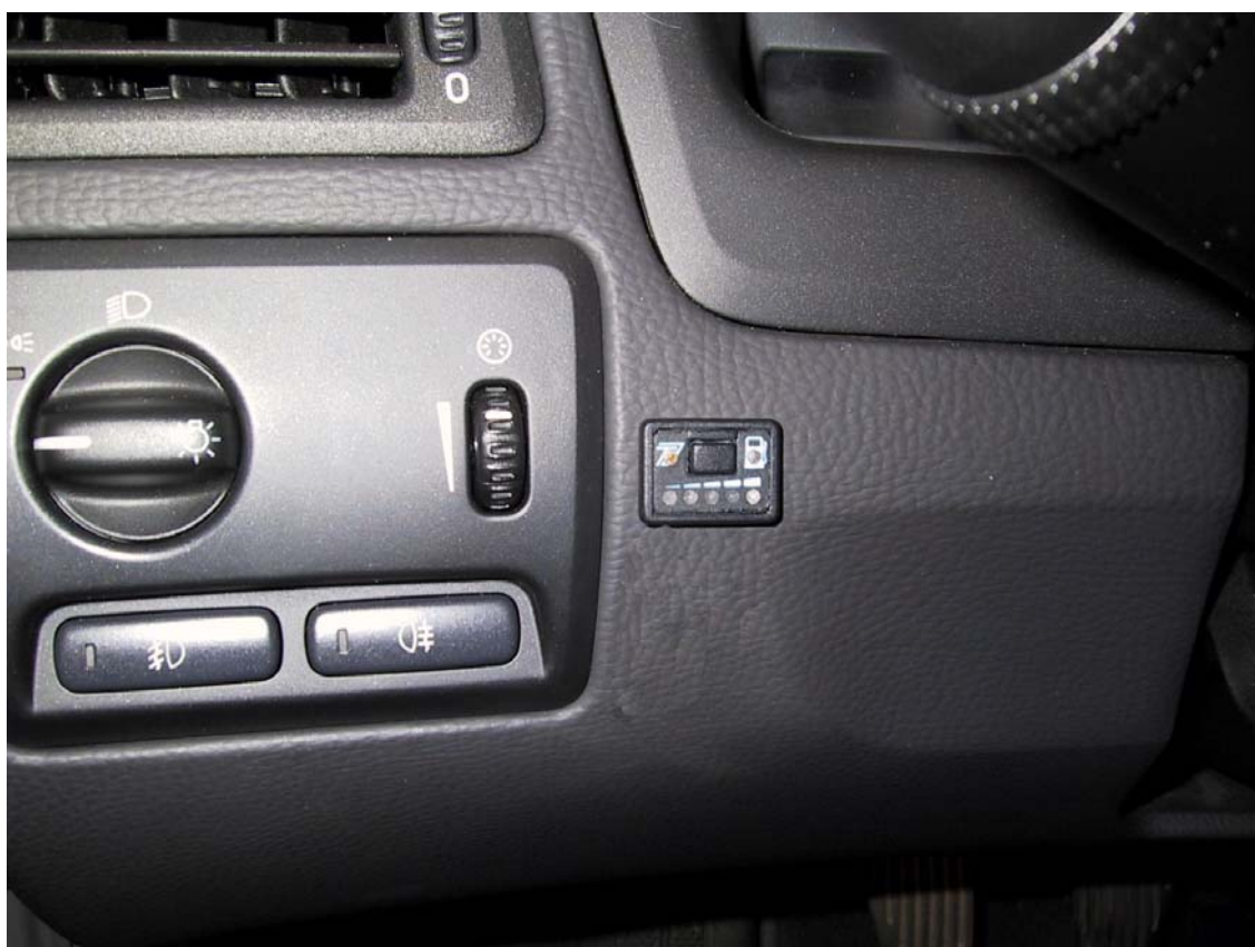
Posizione del commutatore

La Tartarini Auto si riserva di apportare modifiche e migliorie alle indicazioni, illustrazioni e foto presenti nel presente manuale, senza l'obbligo di nessun preavviso