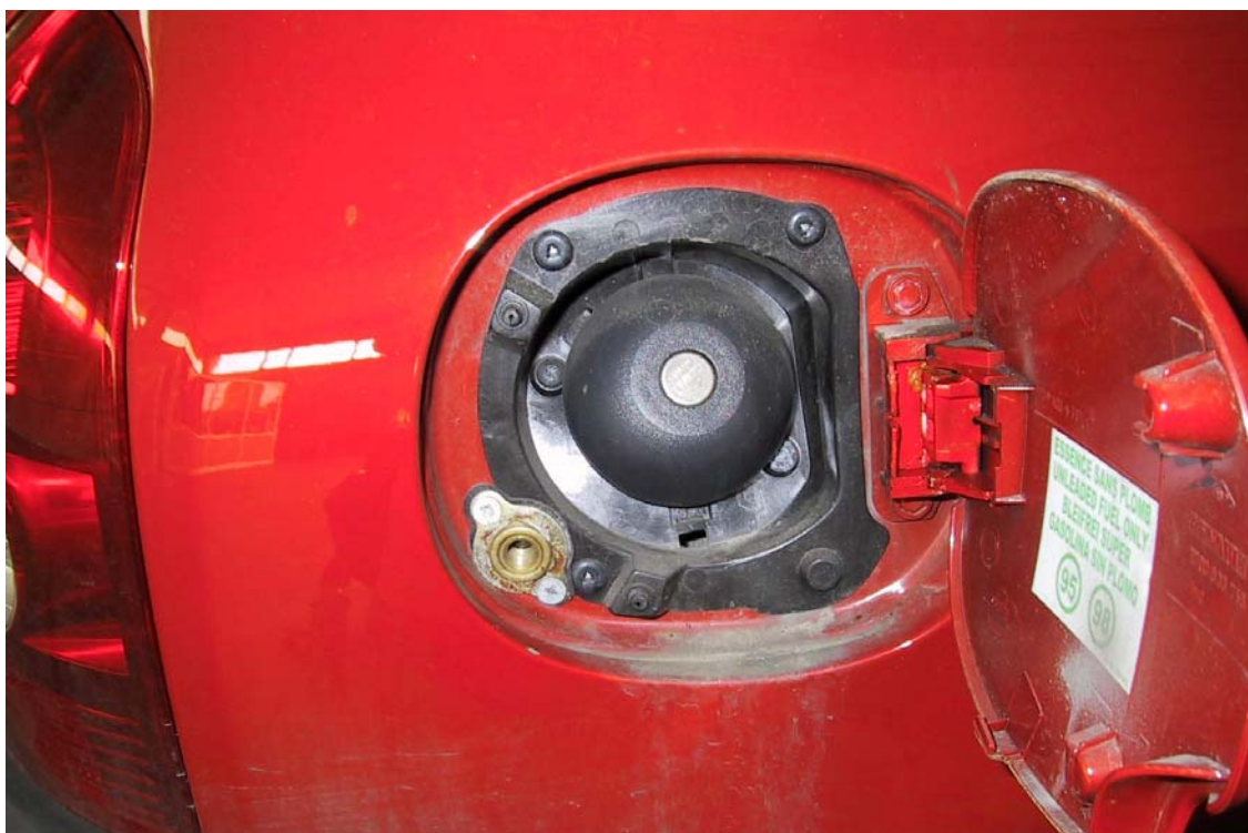
Posizione valvola di carica del gas