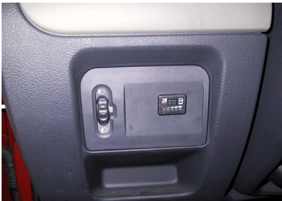
Posizione del commutatore

La Tartarini Auto si riserva di apportare modifiche e migliorie alle indicazioni, illustrazioni e foto presenti nel presente manuale, senza l'obbligo di nessun preavviso