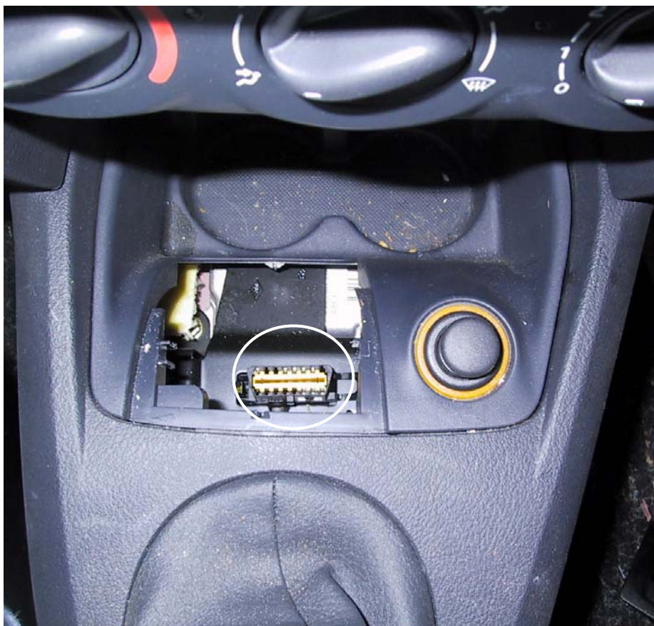
Posizione presa OBD