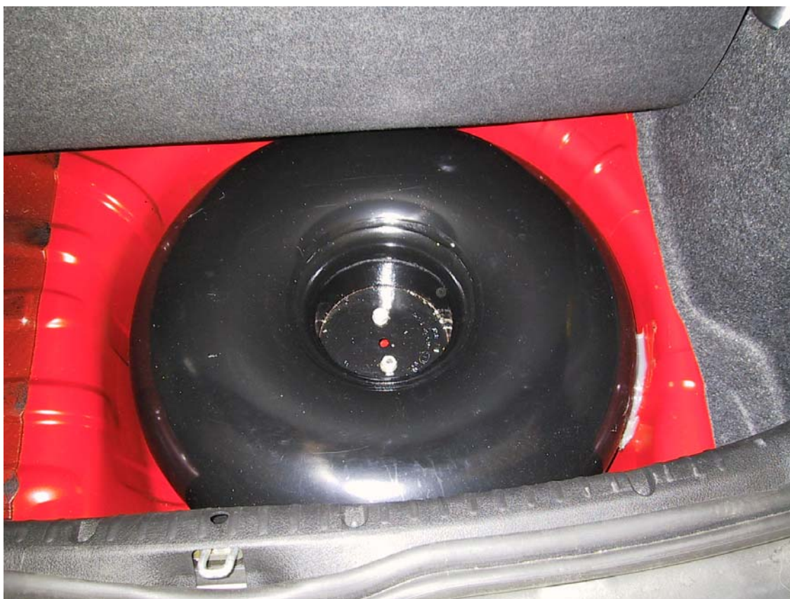
Installazione del serbatoio del gas

La Tartarini Auto si riserva di apportare modifiche e migliorie alle indicazioni, illustrazioni e foto presenti nel presente manuale, senza l'obbligo di nessun preavviso