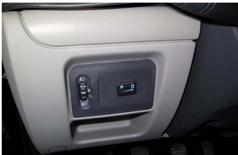
Posizione del commutatore.

La Tartarini Auto si riserva di apportare modifiche e migliorie alle indicazioni, illustrazioni e foto presenti nel presente manuale, senza l'obbligo di nessun preavviso