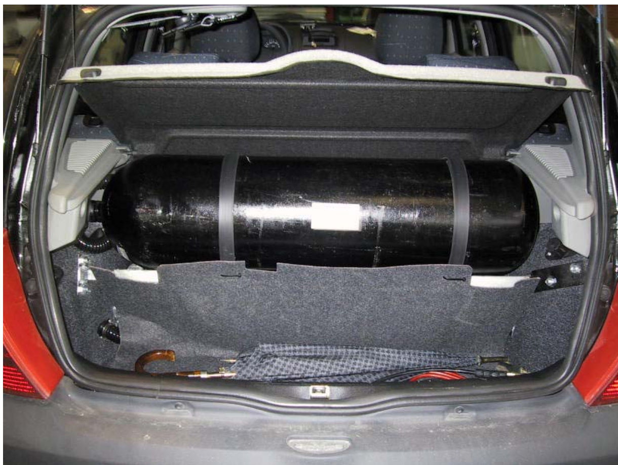
Installazione bombole metano.