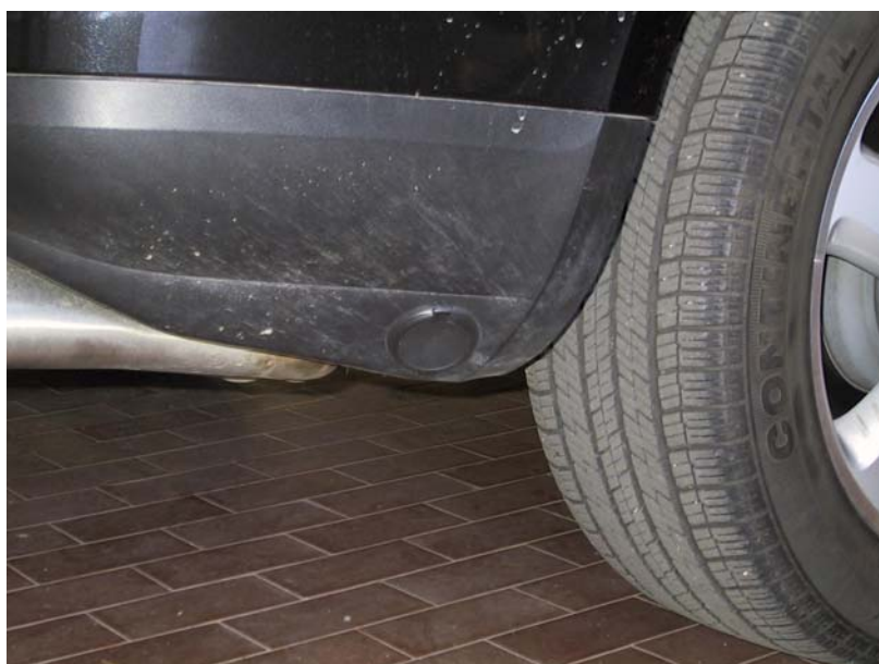
Valvola di carica.

La Tartarini Auto si riserva di apportare modifiche e migliorie alle indicazioni, illustrazioni e foto presenti nel presente manuale, senza l'obbligo di nessun preavviso