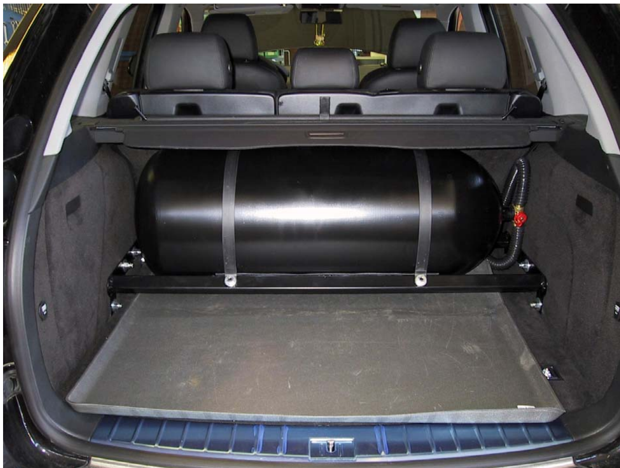
Installazione bombola metano.