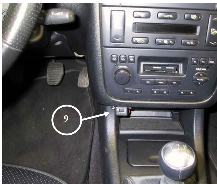
9) Posizione del commutatore