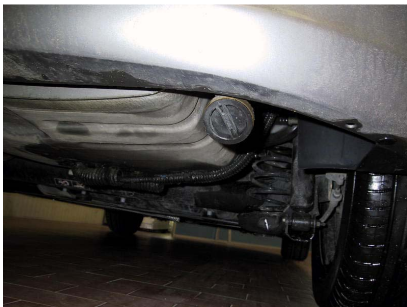
Valvola di carica.

La Tartarini Auto si riserva di apportare modifiche e migliorie alle indicazioni, illustrazioni e foto presenti nel presente manuale, senza l'obbligo di nessun preavviso