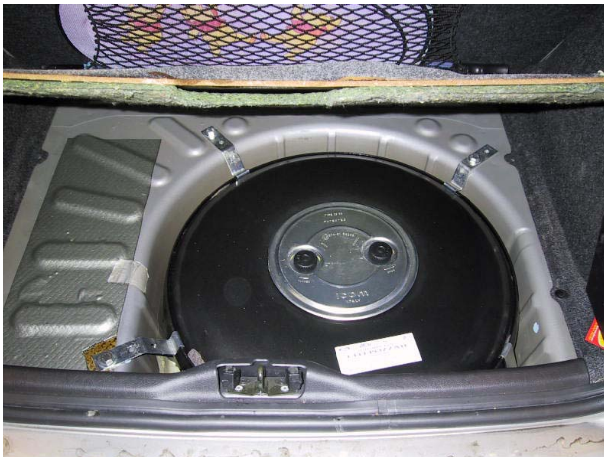
Installazione del serbatoio gpl