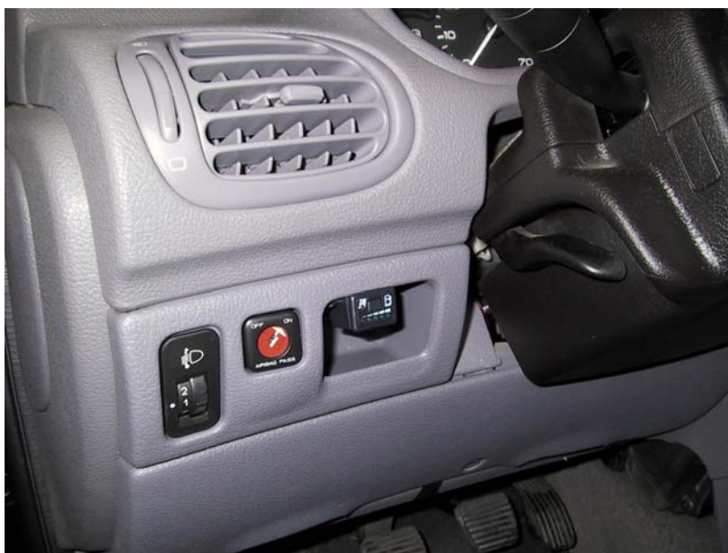
Posizione del commutatore

La Tartarini Auto si riserva di apportare modifiche e migliorie alle indicazioni, illustrazioni e foto presenti nel presente manuale, senza l'obbligo di nessun preavviso