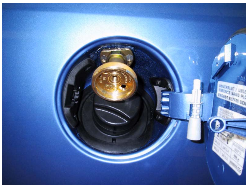
Valvola di carica.