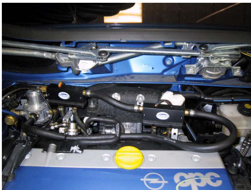
Posizione gruppo iniettori e riduttore gas.