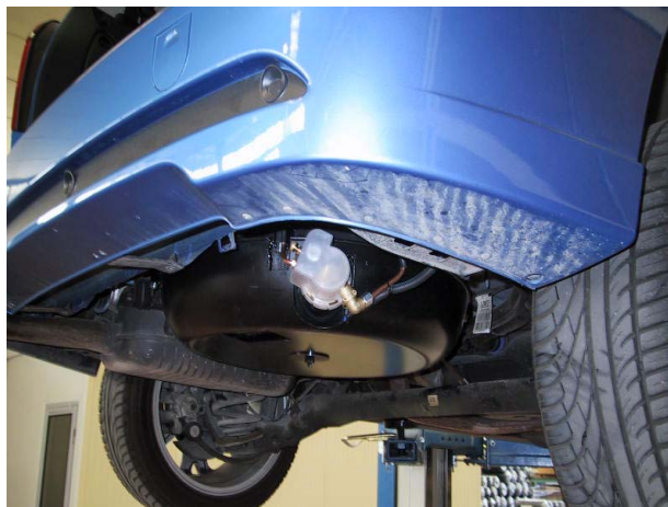
Installazione serbatoio del gas.