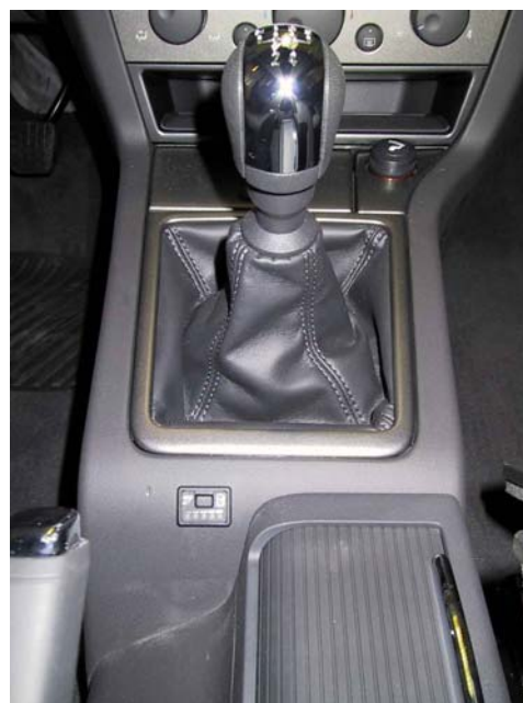
Posizione del commutatore.