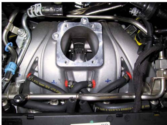
Raccordi di iniezione gas