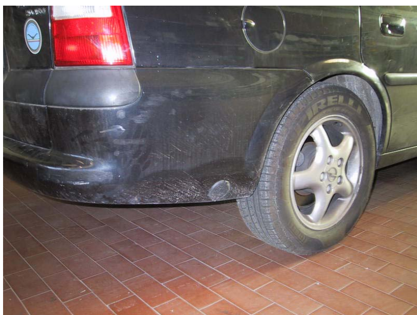
Valvola di carica.