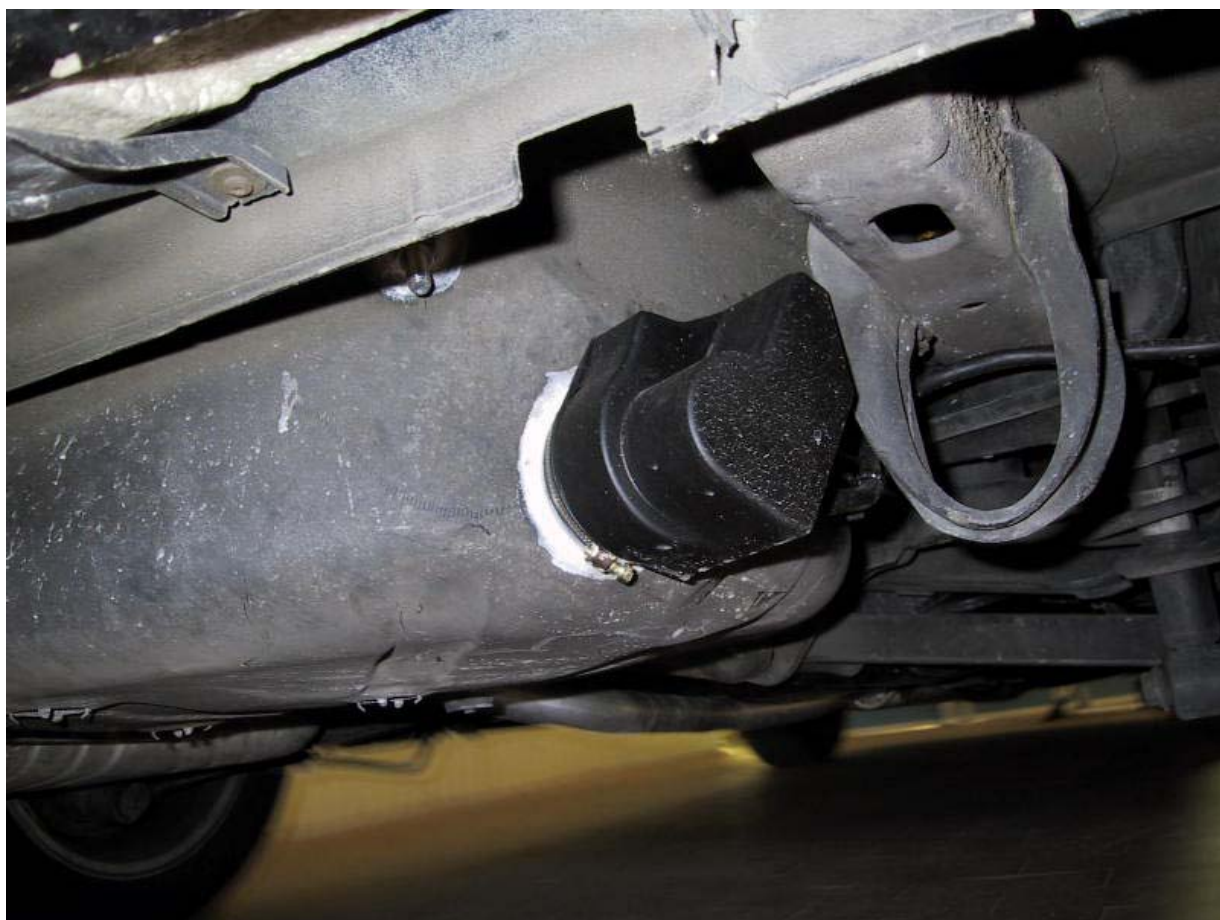
Installazione serbatoio del gas