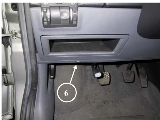
6) Centralina del gas installata sotto il cruscotto.