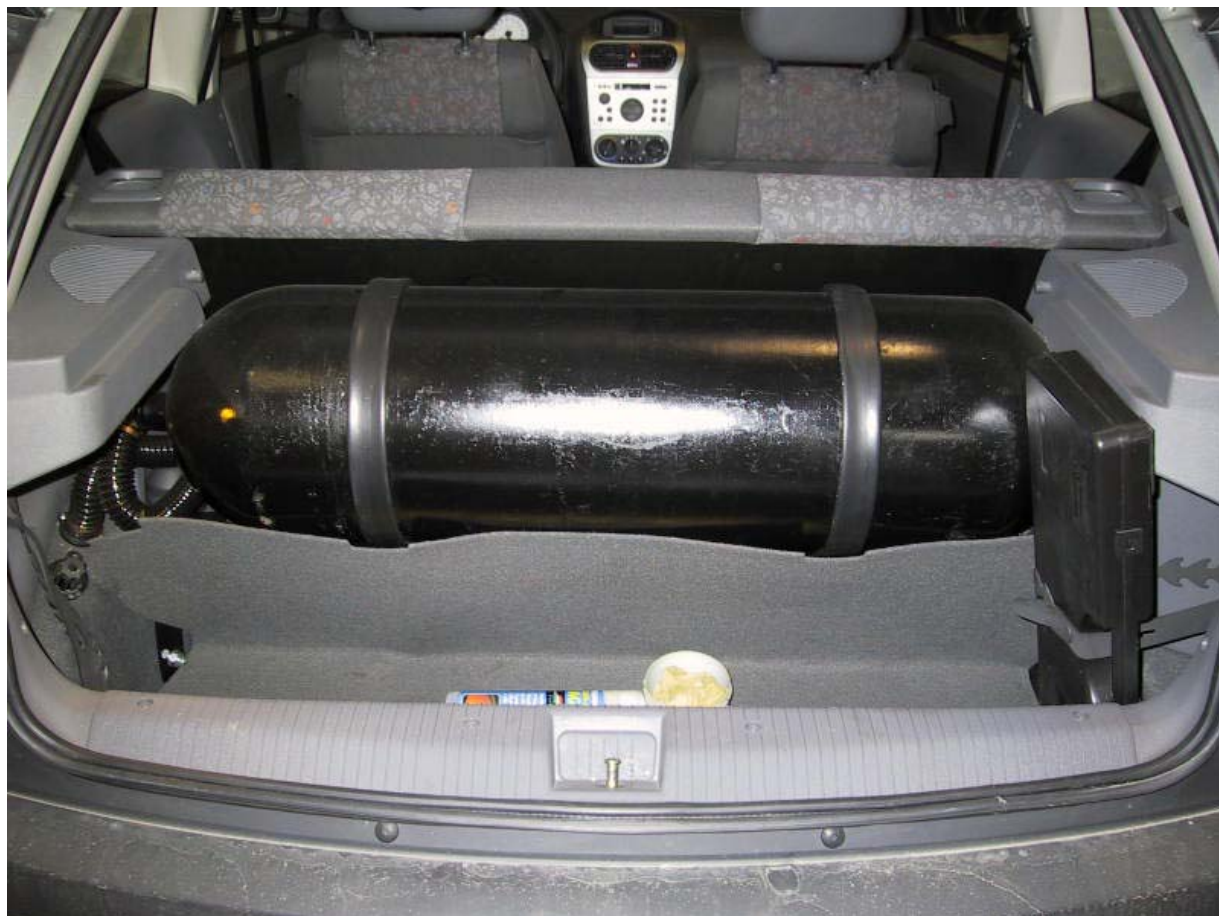
Installazione bombole metano.