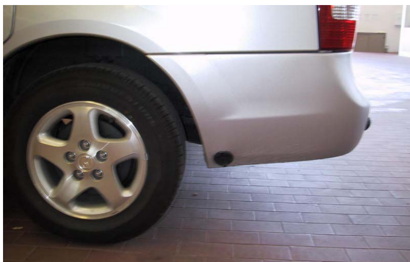
Valvola di carica del gas