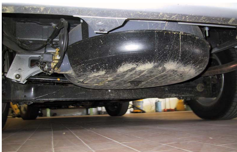
Installazione serbatoio del gas