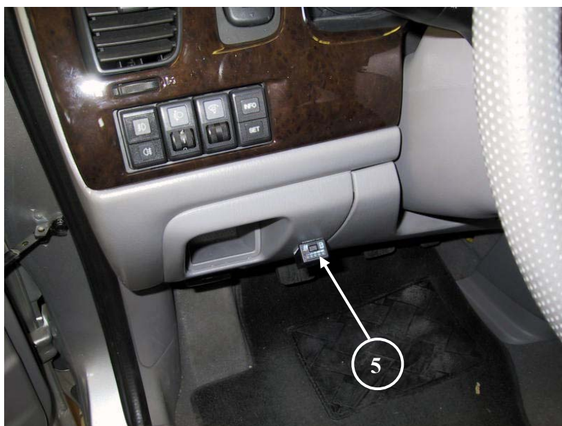
5) Posizione del commutatore.