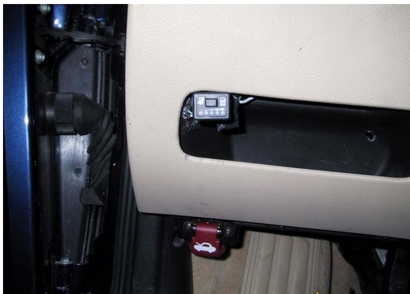
Posizione del commutatore.